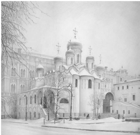
La Chiesa dell'Annunciazione al Cremlino

tani, né marmo di Carrara, né carnevali, né pesto alla genovese, né Romeo-e-Giulietta, né mozzarella, né cappuccino, né eruzione del Vesuvio, né disastro di Pompei, né mafia, né moda italiana, né Mussolini, né Armani, né Ponzio Pilato, né benedicta tu in mulieribus, et benedictus fructus ventris tui Jesus . Non pende la torre di Pisa, non si allaga Venezia. Niente passero di Catullo. Nessuno a scoprire l'America. Nessuno a dover costruire il Cremlino di Mosca.