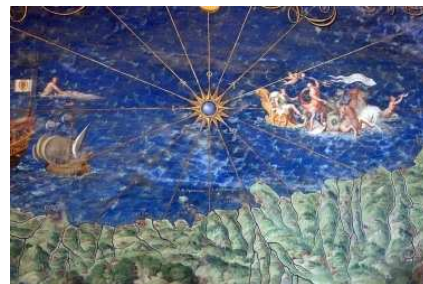
Musei Vaticani Carta d'Italia Particolare

Togliete alla cultura gli stili gotico e romanico, eliminate gli archi, le costruzioni a volta, la chiave d'arco, sottraete la pianificazione urbanistica, i giardini, le fontane, tutte le città europee, castelli, fortezze, guglie, ponti gobbi, colonnati e atrii, cancellate pure tutta San Pietroburgo e scrollate dalle mani le sue ceneri, come se non fosse mai esistita. Via, al diavolo tutto. Il Rinascimento, fuori. Giotto, Michelangelo, Raffaello... via, via! Dimenticate tutta la pittura: è stata solo un sogno. L'opera lirica? Scomparsa, come peraltro il canto in generale, e foratevi pure i timpani. Spargete il vino, perché berrete ciofecca d'orzo.