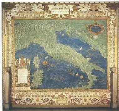
Musei Vaticani Carta d'Italia

mai? Dove sono i consoli, i proconsoli, il senato, i partiti, i patrizi, i plebei, e insomma la repubblica? E il diritto romano? Ehi! E dove sono i teatri? Dove gli storici, gli oratori? Forse si entusiasmerà un persiano all'udire il chiasso e il fremito del pubblico che prende posto a teatro – e nel mentre il cielo si fa più scuro, l'oleandro approfondisce il suo aroma, e sta per spegnersi Venere, la stella della sera, che non è affatto una stella...? Forse un persiano andrà in estasi davanti ai rotoli degli storici, ai processi e agli agoni giudiziari? Rimarrà incantato dall'arringa di un Cicerone oppure – vista la mancanza – di un Demostene? Potrà mai provare rispetto per un'istituzione simile, e d'incanto desiderarla anche a casa propria, per avere uno spazio pubblico dove qualunque volenteroso verrebbe a battere la lingua? Impalare, piuttosto, e bonificare i fori con la calce viva! Addio Padva e Kučerenci... 1 E dove sono le terme, i vestiti leggeri, dove i menti rasati, le ville con terrazze? Dove sono le matrone di rispetto, le degne madri dei degni cittadini? Dov'è il rispetto dei patti? Dov'è il bene pubblico? La poesia, la poesia dov'è mai? E la satira!!! Chi tra i persiani sopporterebbe poi la satira? E la corrispondenza privata? Le gare sportive a nudo? La libertà di fronte agli dei?