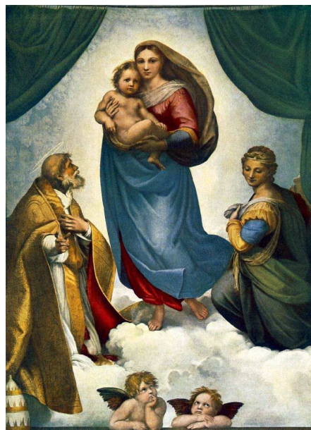
Raffaello Sanzio Madonna Sistina 1512-1514

«la Sistina “non sarebbe legata ad una chiesa, né esigerebbe una determinata collocazione” [...] è corretto se pensato esteticamente, eppure manca della verità più propria. In qualunque posto dove questa immagine potrà ancora essere collocata, là essa avrà già perduto il suo luogo. Le resta preclusa l'ostensione della sua essenza in maniera inaugurale, vale a dire la determinazione di questo stesso luogo. L'immagine, trasformata nella propria essenza in quanto opera d'arte, si smarrisce nell'estraneo. [...] La rappresentazione museale livella ogni cosa nella uniformità dell'esposizione ( Ausstellung ). In questa non c'è alcun luogo ma solo posti. La Sistina dovrebbe stare in una particolare chiesa di Piacenza non in senso storico-antiquario ma secondo la sua essenza di immagine. In conformità a questa, l'immagine esigerà sempre di essere in quel luogo».