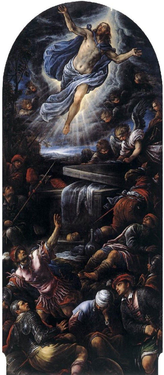
Francesco Bassano Resurrezione di Cristo 1584-88.