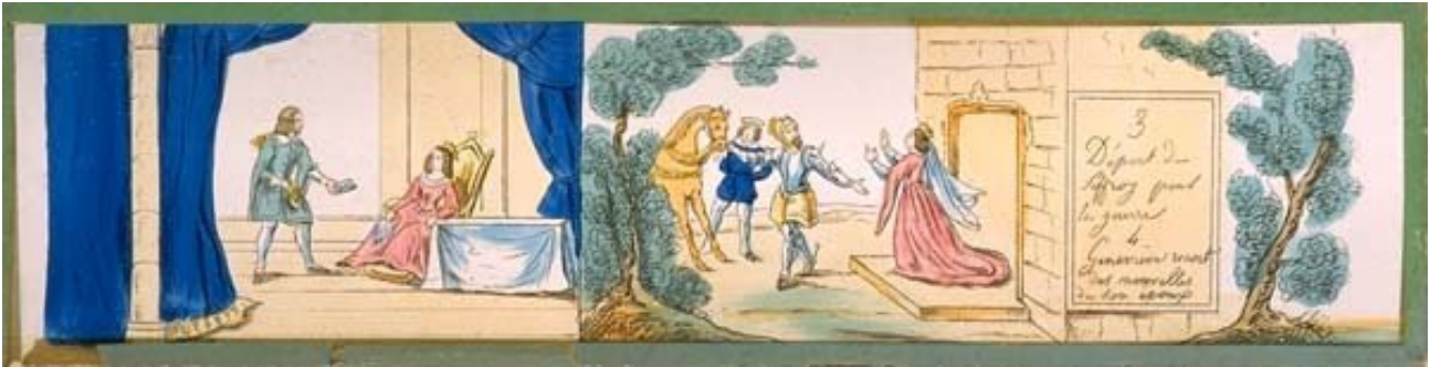
Dalla serie di 6 lastre di lanterna magica. Riporto litografico colorato, 28 x 7 cm. Illiers-Combray, Musée Marcel Proust

dandosi sulle loro pieghe, scendendo nelle concavità. Il corpo stesso di Golo, di un'essenza sovranaturale quanto quella della sua cavalcatura, si disimpegnava da ogni ostacolo naturale, da qualunque oggetto incongruo che incontrava, prendendolo come ossatura, come interno di se stesso, anche se si trattava del pomo della porta, sul quale subito si adattava