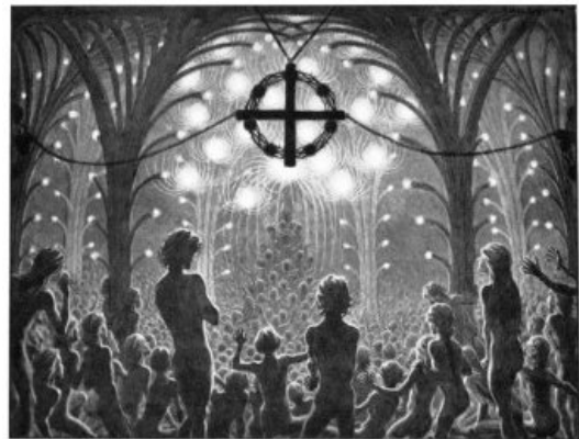
Fidus, Im Tempel der Zweieinheit (Nel Tempio del due-in-uno), 1914, cartolina postale.

nocente. Ma, a forza di negare il Male, l'angelismo finisce col celebrare gli attributi del Maligno: i peli, gli umori e gli odori forti, in breve tutti gli attributi che ai nostri occhi contraddistinguono le produzioni artistiche dette "d'avanguardia"... I discepoli di Allen Ginsberg conosceranno in effetti la discesa agli inferi, nella bolgia piena di liquido nero e puzzolente che Dante ha descritto nel suo Inferno .