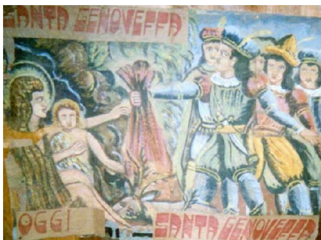
Cartellone del Teatro dei Pupi

La storia di Genoveffa di Brabante sembra comunque essere quella che, accanto a Barbablù, ha più colpito l'immaginazione di Proust bambino. Le "piccole lastre di vetro, dai colori così mistici" ( Jean Senteuil ) che si