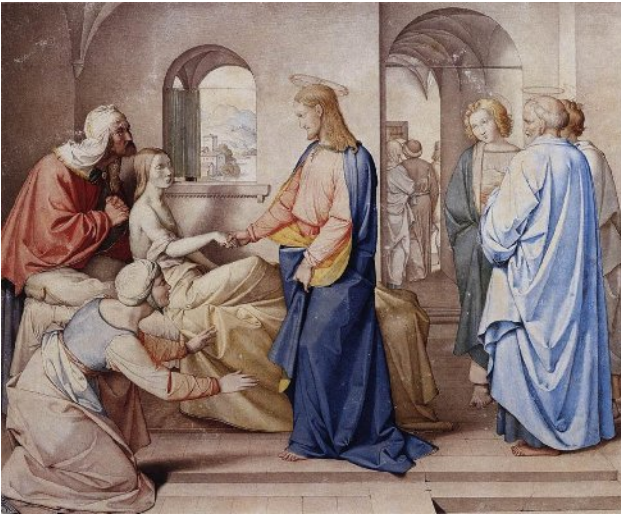
Friedrich Overbeck Cristo resuscita la figlia di Giaro (1815).

vanguardia esposte nelle chiese, che impongono la vista del sangue e di altri umori, hanno mai rispettato il simbolismo sublime di questi flussi corporei?