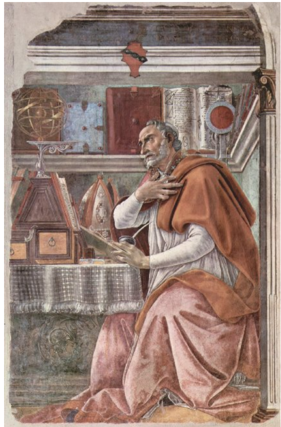
Sandro Botticelli, Sant'Agostino nello studio , c. 1480 Firenze, chiesa di Ognissanti.

In questo forse consiste la potenza e la singolarità della religione che egli annuncia e che diffonderà in Europa: questa religione è fondata sul dogma di un'incarnazione, l'apparizione di un corpo, di una carne, di un Figlio a immagine del Padre, un'osmosi tra la