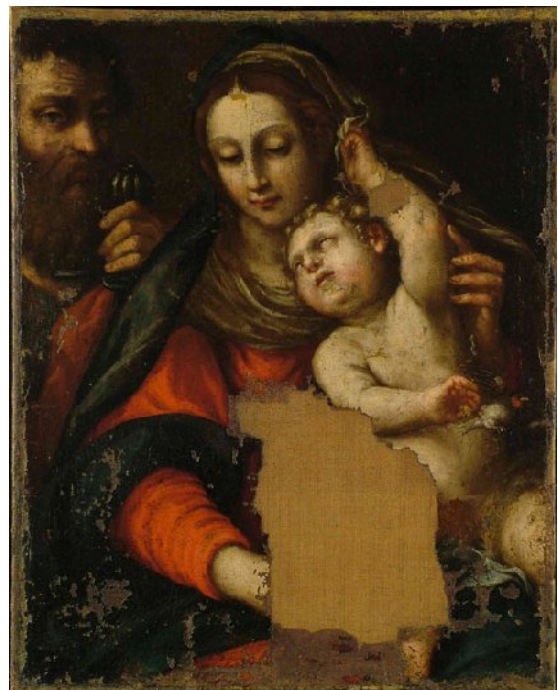
Anonimo Bolognese (metà del XVII sec.) Madonna con Bambino in braccio che con una mano gioca con i suoi capelli e con l'altra stringe un pettirosso. Sulla sinistra in penombra San Paolo. Sfondo scuro monocromo. 72x57,5 cm. Olio su tela.

Quale religione ha dipinto tante volte, da Giotto a Maurice Denis, il bambino in tutte le posizioni dell'infanzia, gesti, sguardi, passioni di bambino, con le sue golosità e curiosità, quando è in piedi sulle ginocchia della madre? Come ha potuto la Chiesa attuale voltare le spalle a una tale ricchezza? Mi ricordo di un aneddoto molto significativo: il Cardinale