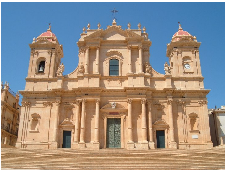
La cattedrale di Noto restaurata.