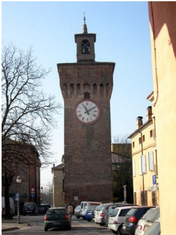
Prima del terremoto. Finale Emilia - Torre dei Modenesi.

sono solo tre secoli, c'è la fine dell'autorità (in Val di Noto il viceré spagnolo diede pieni poteri al duca di Camastra, in Abruzzo la ricostruzione si è persa nel labirinto degli enti locali, degli uffici ministeriali e dei tribunali); c'è la fine dell'urbanistica (l'aristocratico Giuseppe Lanza era un genio dei piani regolatori: come se oggi i democratici o Vasco Errani o Raffaele Lombardo fossero in grado di spiegare il da farsi a Marco Romano o Nikos Salingaros); c'è la fine dell'architettura (al posto dei frati e dei padri gesuiti che senza l'alibi-zavorra di un titolo di studio disegnarono le facciate apprezzate dall'Unesco oggi ci sono soltanto dei laureati); c'è la fine della manualità edilizia (i muratori stranieri, che riempiono il vuoto lasciato dalla manodopera locale, non sono capaci di alzare un muro di mattoni faccia a vista). Ma forse per spiegare e sintetizzare tutto questo melanconico regresso bastano due versi del Salmo 126: "Se il Signore non costruisce la casa, invano vi faticano i costruttori". Così quando ho visto