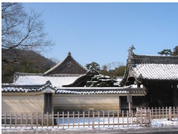
Jingu (Ise Shrine) Saisyu-Syokusya

sione', infatti: i Paesi orientali la coltivano addirittura con cerimoniali sacri: i santuari del complesso di Ise in Giappone vengono smantellati e ricostruiti identici una volta ogni vent'anni dal momento che il tempo e i terremoti ne offuscano la bellezza, e siamo alla sessantunesima ricostruzione. Man mano che ci si sposta verso l'Occidente, la spinta psicologica al 'restauro integrale' non viene meno, e si vadano a vedere le magnifiche ricostruzioni della Cattedrale di Montecassino, della Frauenkirche di Dresda o del Ponte di Mostar demoliti dalla guerra, o quella della Cattedrale di Messina demolita dal terremoto nel 1908 e ricostruita negli anni 1919-29 3 . Non è solo un vago 'sentimento' , infatti, quello del quale parlavamo: lo stesso 'spaesamento' (da paese , con s sottrattivo) lo proveremmo se qualcuno ci parlasse senza preavviso in una lingua diversa dalla nostra lingua materna.