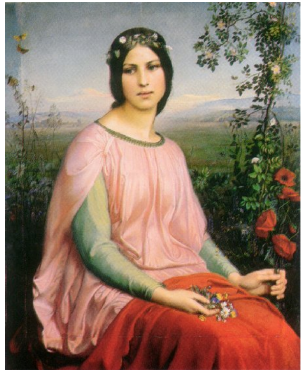
Louis Janmot, Fiore dei campi , 1845, Musée des Beaux-Arts di Lione.

I commenti moderni tendono ad evidenziare il sostrato inconscio e la matrice biografica dell'opera, e questo può valere di più per la seconda parte (che non è esposta nel Museo), dove i blocchi allegorici assumono una pesantezza angosciata. Il ciclo pittorico si avvale invece di un simbolismo gentile, aurorale, che ritroveremo in Odilon Redon, in Degouve de Nuncques, ed insieme di una rappresentazione del male assai più persuasiva della posteriore compiaciuta arte decadente, affollata di Gorgoni e Salomè. L'ambizione filosofica sta nella sequenza narrativa, nei vuoti o nelle concatenazioni tra un'immagine e l'altra, e se non va ignorata, è innegabile che i quadri del Poema