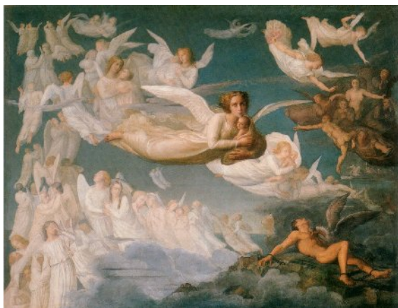
Il passaggio delle anime.

Poema dell'anima , che lo impegnerà per 50 anni, un'impresa totalizzante e ambiziosa, specchio fatale del suo percorso umano e professionale. Vari schizzi e disegni documentano la genesi dell'opera nel soggiorno romano, sotto l'influenza della grande arte rinascimentale, di Ingres e dei nazareni.