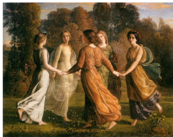
Raggio di sole.

Rassicurati di fronte alle insidie del male dall'educazione religiosa, dai sacramenti e da un modello di vita angelicata, l'anima e il suo doppio intuiscono l'esistenza di un'altra scala di valori che fa dell'arte e della conoscenza uno strumento di trasfigurazione della materia stessa. Come in sogno, hanno la visione di un corteo di angeli personificanti arti, scienze e virtù che in un flusso quasi circolare collegano terra e cielo, e quindi l'anima alla sua origine divina: non l'occultismo e la teosofia, ma la poesia, la pittura, la musica, l'architettura, l'astronomia, la filosofia e infine la santità danno all'anima la disciplina della perfezione umana. Si riferiscono a questa immagine i versi del poema che abbiamo tradotto.