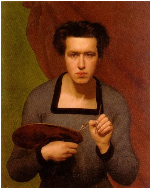
Louis Janmot, Autoritratto , 1832, Musée des Beaux-Arts di Lione.