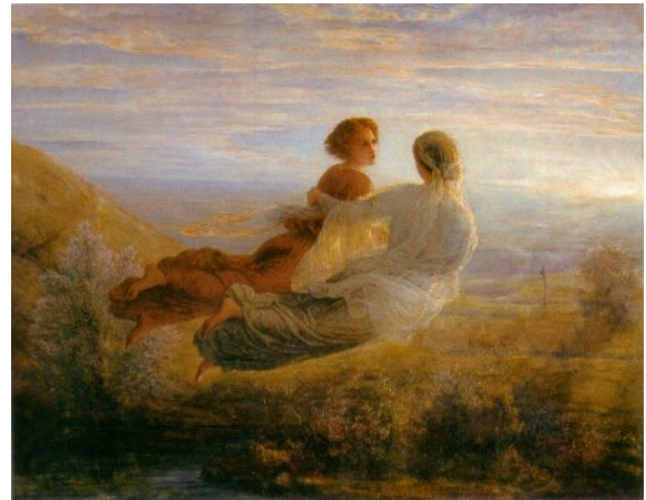
Il volo dell'anima.

Ma i cieli si riaprono intorno all'anima, e questa volta è lei che guida il suo doppio femminile verso la cima della montagna.