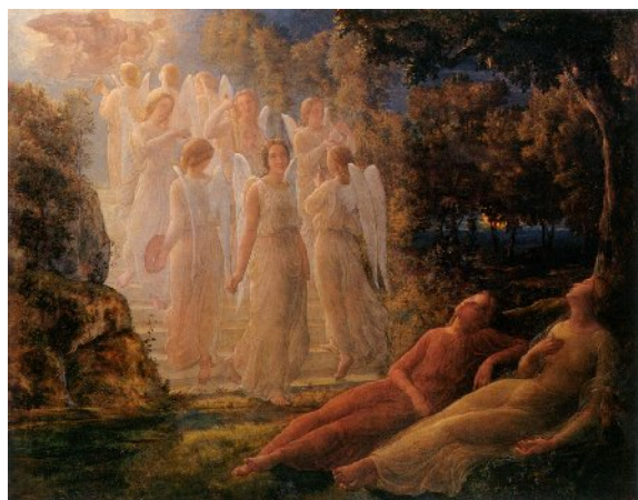
La scala d'oro.

Rassicurati di fronte alle insidie del male dall'educazione religiosa, dai sacramenti e da un modello di vita angelicata, l'anima e il suo doppio intuiscono l'esistenza di un'altra scala di valori che fa dell'arte e della conoscenza uno strumento di trasfigurazione della materia stessa. Come in sogno, hanno la visione di un corteo di angeli personificanti arti, scienze e virtù che in un flusso quasi circolare collegano terra e cielo, e quindi l'anima alla sua origine divina: non l'occultismo e la teosofia, ma la poesia, la pittura, la musica, l'architettura, l'astronomia, la filosofia e infine la santità danno all'anima la disciplina della perfezione umana. Si riferiscono a questa immagine i versi del poema che abbiamo tradotto.