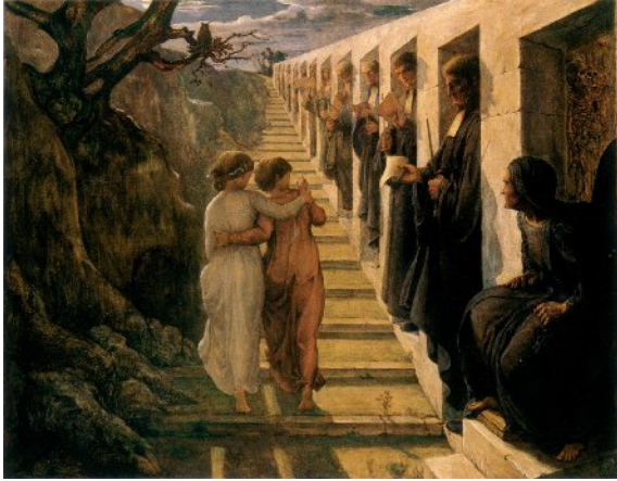
La cattiva strada.

L'anima e il suo doppio, cresciuti fino all'età adolescenziale nel cerchio protettivo e devoto della famiglia, fanno conoscenza con le insidie dell'istituzione sociale materialistica. Janmot si riferisce al monopolio di stato dell'istruzione, contestato dai cattolici, ma l'immagine è di una tale potenza da astrarre dall'attualità del tempo e rappresentare la permanente minaccia che l'arroganza intellettuale e il suo braccio politico esercitano sulla persona umana. Se l'innocente bellezza della natura conduceva verso l'alto, a maggiore consapevolezza e maturità, la scala pietrosa tra la roccia nuda e le nicchie da cui si affacciano, minacciosi o suadenti, i cattivi maestri, conduce ad un nulla in cui agitano ombre informi. La luce è gelida, lunare, i movimenti come sospesi, in attesa.