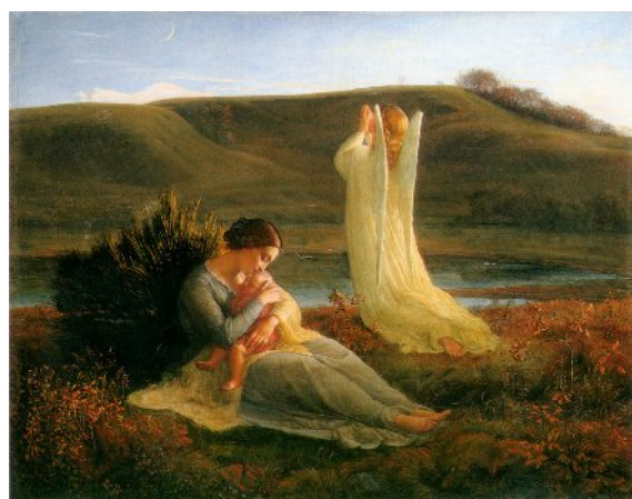
L'angelo e la madre.

Ma contrariamente all'architettura vistosa della basilica, dominante la città, l'opera di Janmot (che nel frattempo lavora ad opere a soggetto religioso nella sua città e a Parigi), costituisce una specie di "giardino segreto", un'intima meditazione ed insieme una sfida a rendere, attraverso l'arte, condivisibile e persuasivo il suo percorso spirituale.