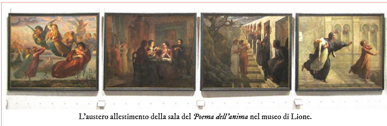
L'austero allestimento della sala del Poema dell'anima nel museo di Lione.

Ognuno di questi momenti, disposti in sequenza solo convenzionalmente, in quanto vi è come un andirivieni fluttuante tra gli stadi contemplativi e le insidie dell'esistenza terrena, è contenuto in scenari, che ne sono la proiezione visionaria: dal vaporoso eden dell'idil-