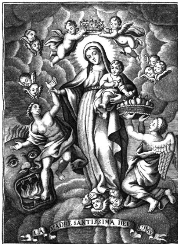
Di Tando Sculp.