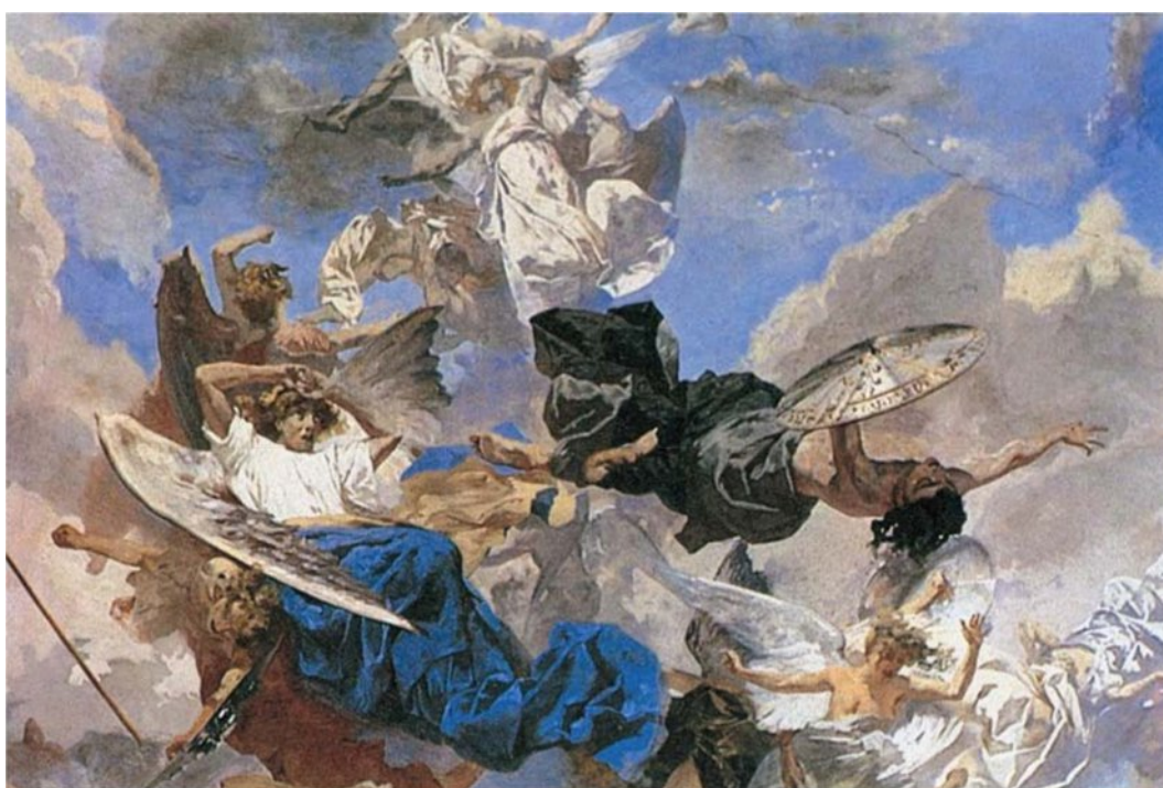
Paolo Gaidano. La caduta degli angeli ribelli. Duomo di Carignano. Affresco.

dell'«Invisibile», a scoprire un'espressione contemporanea del sacro. Il visitatore iniziato all'arte contemporanea ritrova in questa mostra artisti ufficiali e riconosciuti, tutti concettuali. Molti hanno beneficiato di commesse di arte sacra o sono in attesa di esserlo. Se, nel 1993 nella mostra sull'Arte sacra nel XX secolo, si poteva vedere nella parte contemporanea ancora qualche pittore e scultore, essi sono del tutto scomparsi nel 1996 in questa esposizione-manifesto. La commissaria Christine Buci-Glucksmann evoca, nella prefazione del catalogo, quello che le opere hanno in comune: un'espressione di vuoto e d'isolamento senza rimedio, un sentimento di assenza che non è percepito del resto che come una sete. Da questo sgorga, secondo lei, una forma di sacro, di trascendente implicito.. Il visitatore che guarda questa mostra è dunque vittima di un equivoco perché, entrando, si aspetta di vedere questo «invisibile» promesso nel titolo della mostra, un'altra dimensione di cui ha talvolta l'esperienza o il profondo desiderio. Cerca di comprendere, di interpretare il senso di queste opere in rapporto alla fede, in quanto la Chiesa si è fatta intermediaria tra questi artisti e lui.