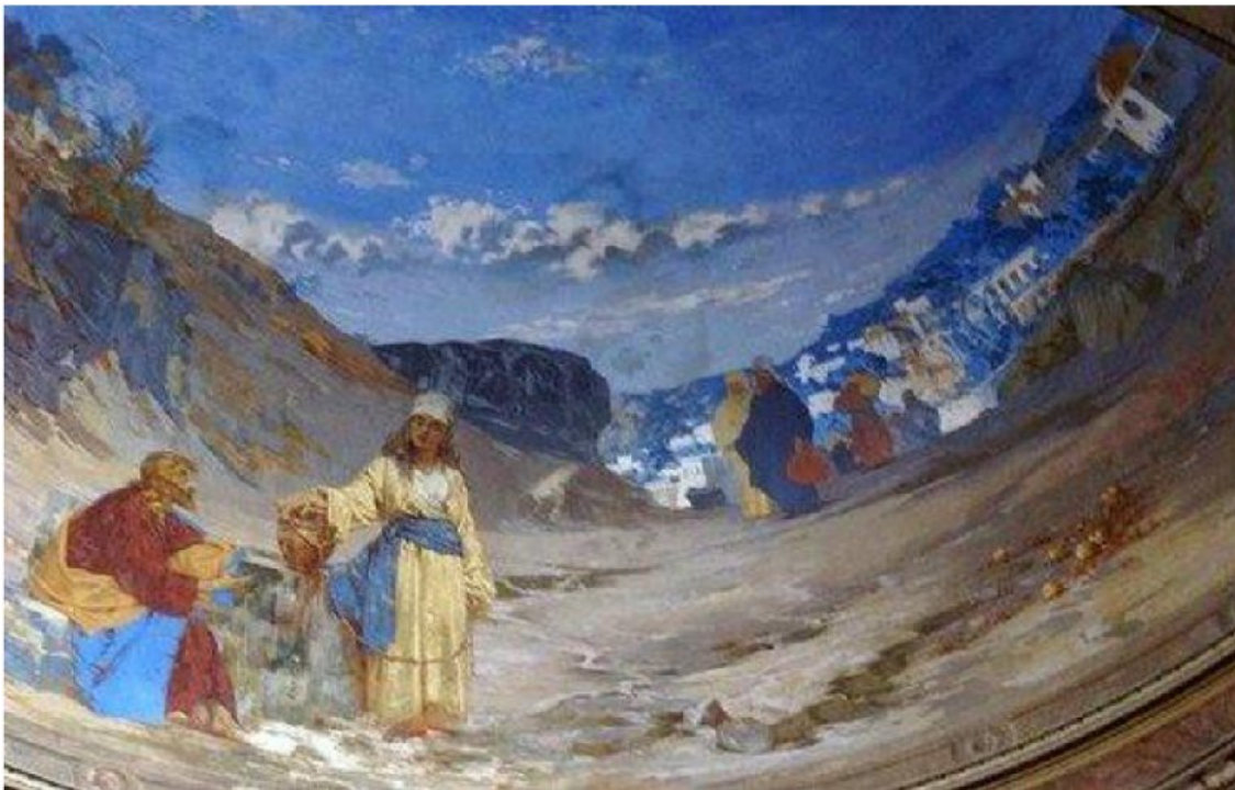
Paolo Gaidano. Gesù e la Samaritana. Duomo di Carignano. Affresco.

Padre Couturier viene strumentalizzato. E' continuamente citato per screditare tutta una corrente della creazione del XX secolo. A partire dal 1944, nei suoi «Cahiers d'Art sacré» aveva condannato in blocco, senza fare distinzioni tra piccoli e grandi talenti, l'arte praticata negli Ateliers d'Art sacré. La sua teoria: se l'arte è geniale, è di per sé sacra; se è mediocre, è un insulto all'arte e al sacro. Bisogna quindi rivolgersi ai geni, personalità esaltate nel XIX secolo dal romanticismo, concezione che ha conosciuto fortune diverse, di cui alcune sono all'origine dei totalitarismi del XX secolo. La Chiesa aveva resistito a queste ideologie, ma