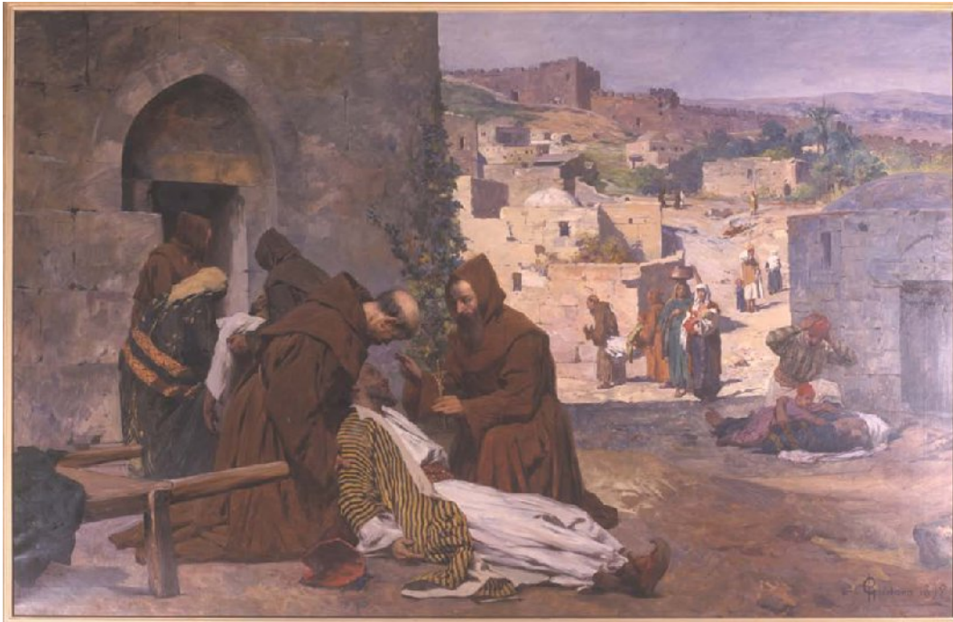
Paolo Gaidano. Le glorie francescane. Olio su tela cm 200x300. Convento della Custodia, Gerusalemme.

Int. Il suo nuovo libro Sacré Art contemporain parla specialmente di un fenomeno che sembra strano: la sacralizzazione dell'Arte contemporanea.