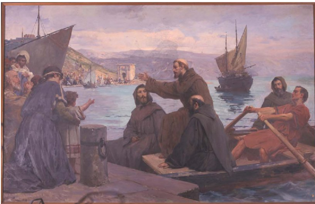
Paolo Gaidano. Le glorie francescane. Olio su tela cm 200x300. Convento della Custodia, Gerusalemme.

In questo partenariato Stato-Chiesa, si ha