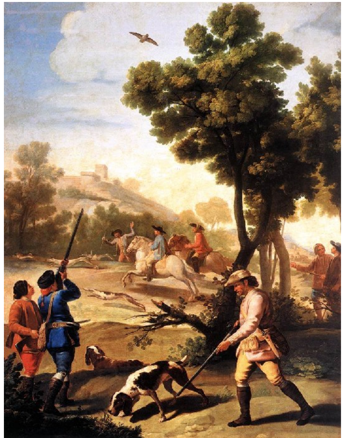
Francisco de GOYA Y LUCIENTES, The Quail Shoot , 1775, Museo del Prado.

E un sogno il mondo ti pare: la mèliga sotto la loggia, il vecchio sul limitare, la donna curva alla roggia, e i buoi nel campo ad arare.