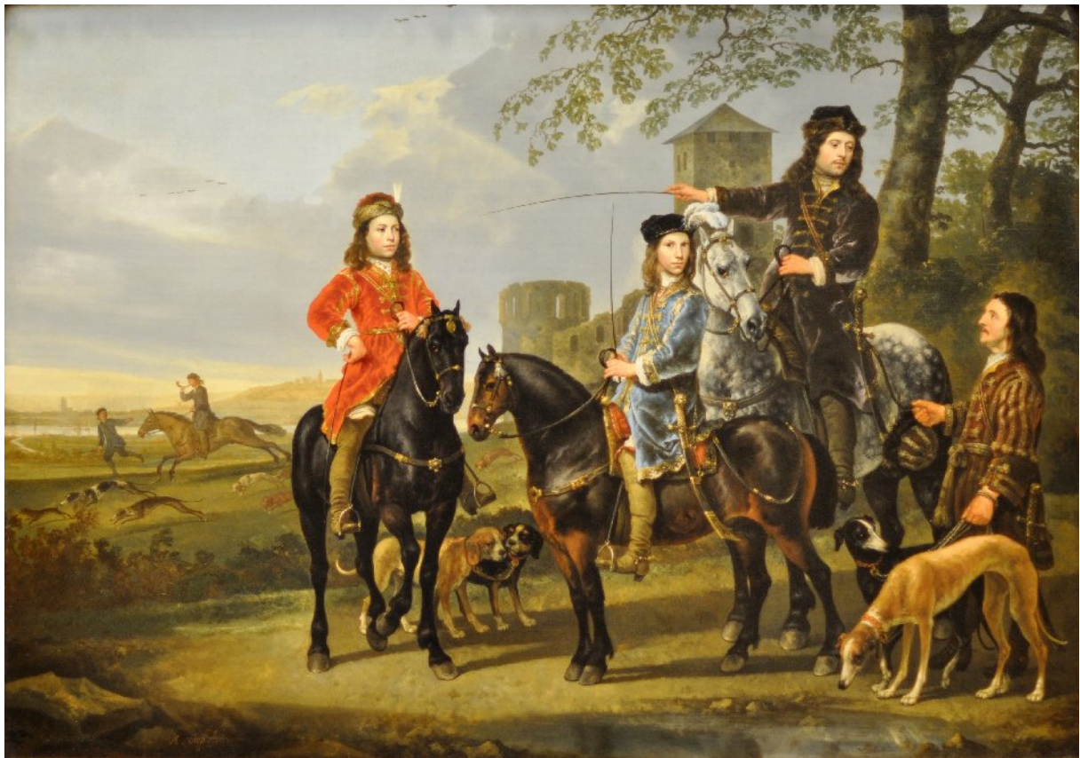
Aelbert Cuyp, Starting for the Hunt-crop .

siamo entrambi, in quel momento, con le stesse aspettative, le stesse emozioni e paure, le stesse debolezze e sofferenze, a goderci quanto ci spetta, a capire più profondamente cosa significa vivere e morire. Essere qui in questa vita, con queste caratteristiche, non è stata una nostra scelta ed anche la preda lo sa, e forse, nel momento in cui si sente braccata, molto più di noi. Lei non può permettersi la paura perché i suoi riflessi devono rimanere attenti e svegli per la fuga. Una normale condizione che la vede «preda» decine di volte al giorno, forse centinaia. In questi momenti, più di altri, siamo consapevoli che questo vivere è un ineluttabile e costante approssimarsi alla morte ed alla preda non fa alcuna differenza che il suo predatore sia cacciatore, lupo, falco o serpente. Essa sa che all'interno del cerchio dell'esistenza questo è il suo ruolo e nei momenti in cui si sente preda, deve man-