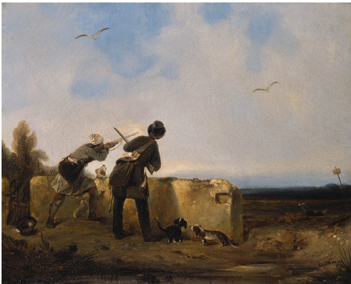
Alexandre Gabriel Decamps (1803-1860), Scena di caccia .

solo a guardare. Caricò il fucile, lo strinse tra le mani e cominciò a camminare lentamente nell'erba bagnata, con passi molto leggeri. Lo guardavo con un misto di stupore e incredulità, per me in quei prati non c'era proprio niente. Il nonno era sempre fermo, in presentat'arm. Stavo quasi per domandargli qualcosa quando una cosa bianca, ad una ventina di metri, si involò dall'erba, come sbucata dal nulla. Il nonno con una velocità ancora maggiore imbracciò e sparò due botte in quella direzione, BAM, BAM! E quella piccola saetta bianca cadde a terra. Presi uno spavento terribile, perché proprio non me l'aspettavo. Tornò sorridendo con un beccaccino in palmo di mano, ancora palpitante e con una piccola macchietta di sangue sul becco. Ho sempre avuto un po' di timore per quel nonno, troppo attivo per essere un vecchio, troppo poco malleabile per fare il nonno. Ma dopo che mi insegnò che le cose esistono a prescindere dal fatto che noi le si conosca o meno, perché non è detto che quel che non si vede necessariamente non