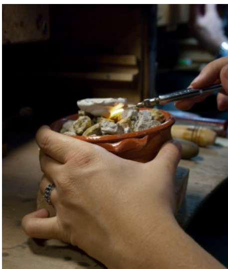
Microsaldatura di un oggetto incluso in materiale refrattario.

vissute, creando strumenti ad hoc o adattando azioni già sperimentate in altre realtà locali.