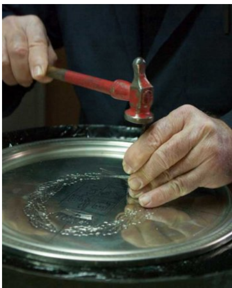
Maestro cesellatore mentre modella una lastra d'argento allettata su pece.