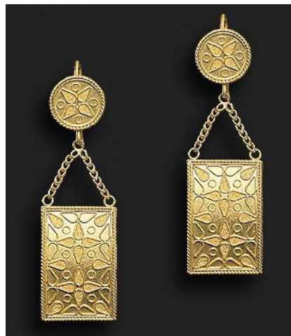
NAOS, 1996, oro 900/1000, altezza 6,3 cm. © Akelo-Andrea Cagnetti. All Right Reserved.

Nel presente articolo si intende dare un contributo nell'esplicazione di tutti i passaggi tecnici e applicativi, in cui si distinsero i maestri orafi dell'antichità, necessari per la realizzazione di oggetti in oro finemente decorati con filigrana, granulazione e granulazione al pulviscolo.