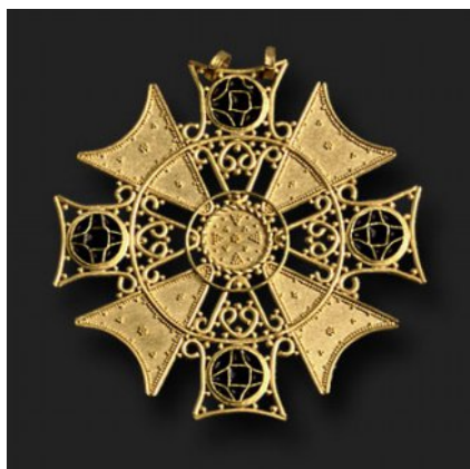
HOEDUS II, 1996, oro 900/1000 e smalto, 7 cm.