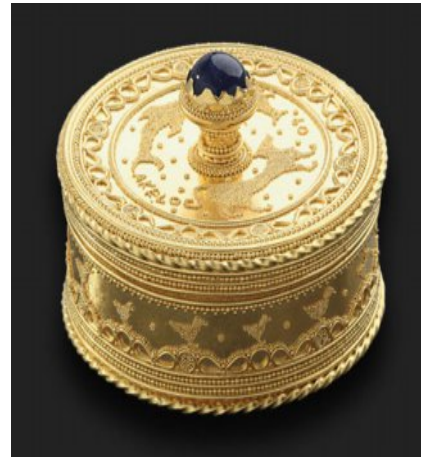
SEGIN, Pisside, 2009, oro 900/1000 e zaffiro, diametro 4,1 cm; max. altezza 2,9 cm. Ora nelle collezioni del Museum of Fine Arts of Boston.

Procedendo in questo modo — secondo l'ordine di grandezza delle parti decorative — si noterà che, ogni qualvolta la soluzione viene applicata, va a inserirsi in tutti quei punti sui quali precedentemente il processo di brasatura non