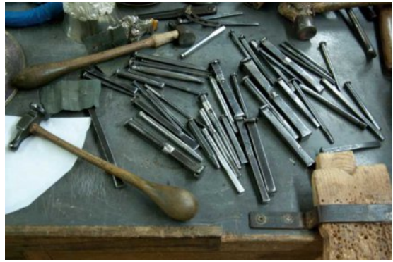
Ceselli e martelli da cesello.

luppo di mercato, ha assunto sempre di più caratteristiche di tipo industriale, supportata da un'industria meccanica capace di realizzare prodotti di altissimo livello. Il primo passo verso la delocalizzazione è stato portare macchine e produzioni sui luoghi più convenienti, il passo successivo ha visto acquisire le macchine direttamente dai paesi nuovi produttori, e con esso la formazione necessaria all'utilizzo, la fase successiva vede la realizzazione anche delle stesse macchine nei paesi nuovi produttori.