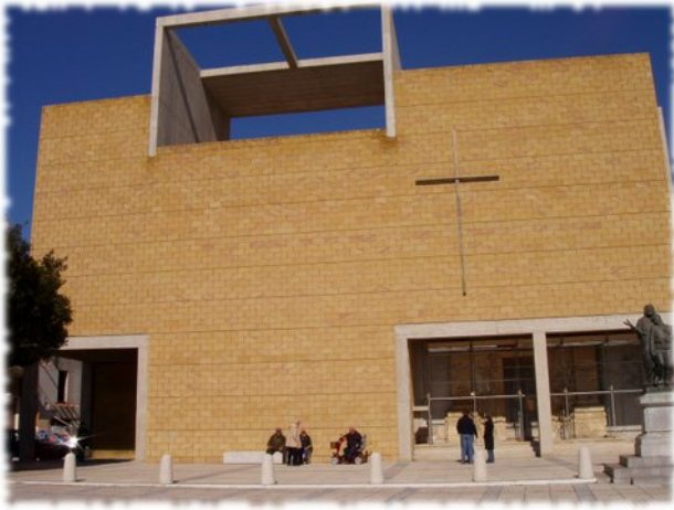
La nuova chiesa madre di Menfi, Vittorio Gregotti, 1993-2004.

fronteggiava il bellissimo paesaggio naturale sullo sfondo del lato opposto. Oggi la piazza è mortificata dall'inquietante composizione minimalista di pietra locale e cemento armato a faccia vista.