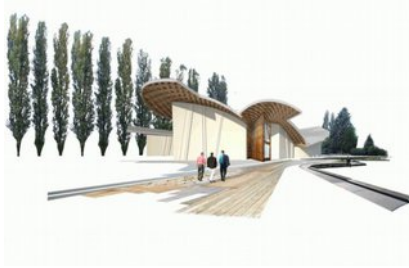
Benedetta Tagliabue, progetto vincitore per la chiesa di Ferrara (Ferrara-Comacchio).