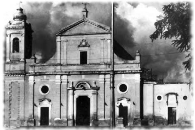
La chiesa madre di Menfi com'era prima del terremoto del 1968.

Uno dei tanti casi eclatanti — se ne contano a migliaia nella sola Italia — è la chiesa madre di Menfi, che ben figurerebbe in una rassegna degli orrori architettonici del XX secolo. Il progetto ha comportato la demolizione immotivata della pregevole chiesa seicentesca originaria, la cui struttura era stata danneggiata ma non compromessa dal terremoto del Belice.