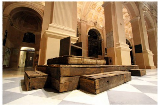
Jannis Kounellis, cattedra episcopale, Arte povera. Cattedrale di Reggio Emilia, 2011.