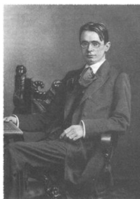
Rudolf Steiner (1861-1925).