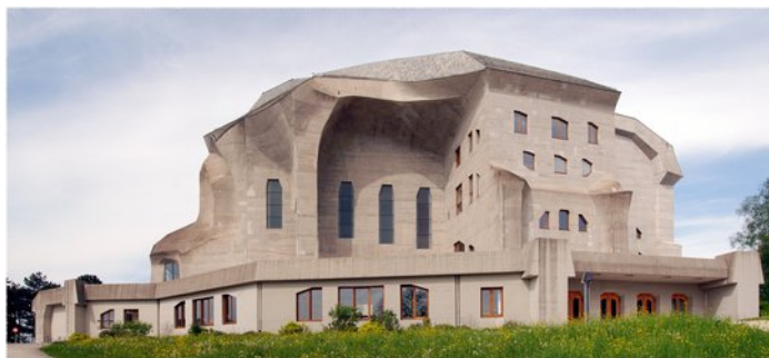
Il secondo Goetheanum, Dornach, 1928.

ti protagonisti della svolta spiritualista nell'arte. Ed è ancora oggi meta di pellegrinaggi devoti.