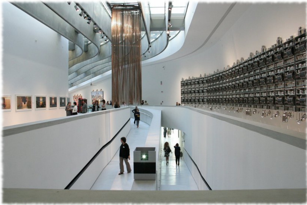
Indian Highway , una mostra del 2011 al MAXXI.

Il messaggio è sempre lo stesso: bisogna seguire il progresso e le mode! Ma quello proposto è autentico progresso? Evidentemente i responsabili del Servizio Nazionale per l'edilizia di culto della CEI pensano di sí.