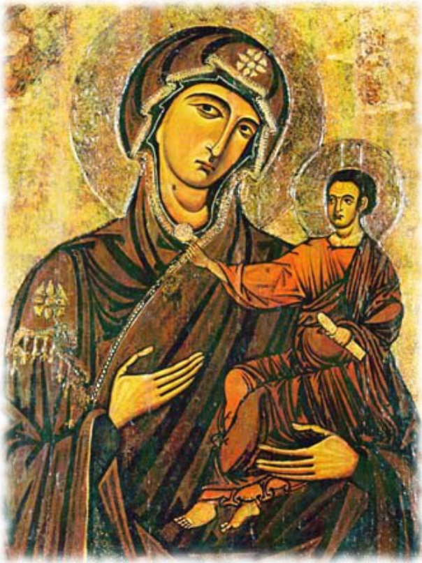
Madonna Odigitria di Guglielmo, ambito bizantino (XII secolo), tempera su tavola.

Le orme lasciate dalla Seconda Persona della Trinità sulle strade degli uomini, hanno reso imprescindibile raccontare le grandi opere di Dio sulla terra in modo vicino e accessibile ai contemporanei dell'artista. Il percorso della creatività, da Cimabue a Caravaggio, non poteva essere più avventuroso e ricco di capolavori dell'arte sacra.