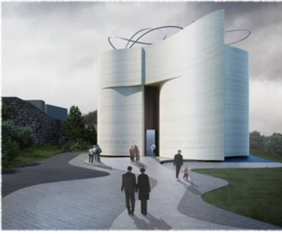
Mario Cucinella, progetto vincitore per la chiesa di Mormanno (Cassano all'Jonio-Cosenza).