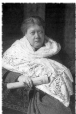
Helena Petrovna Hahn Blavatsky (1831-1891).