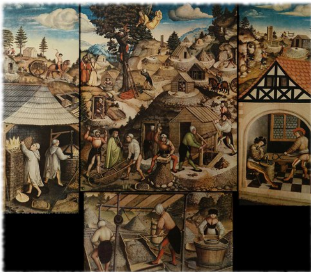
Pala d'altare nella Chiesa di Sant'Anna, Annaberg-Buchholz, con raffigurazione storica della miniera, 1522.

La regione dei Monti Metalliferi, fra la Sassonia e la Repubblica Ceca, era ricca di giacimenti minerari e fin dal Medioevo sfruttata anche per il suo argento.