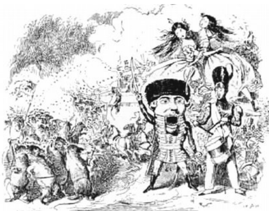
Illustrazione da E. T. A. Hoffmann, Schiaccianoci e il re dei topi (1816)

Ma già molto prima il pupazzo aveva fatto la sua comparsa in un racconto di E. T. A. Hoffmann, Nussknacker und Mäusekönig, Schiaccianoci e il re dei topi , del 1816. La figura era quella di un ussaro che così ci viene descritto: «Portava una bella giacchetta da ussaro di un viola brillante con mostrine e bottoni bianchi e parimenti calzoni nonché i più bei stivaletti che mai furon visti ai piedi di un ufficiale». La trama, fantasiosa e romantica, nella versione di Ale-