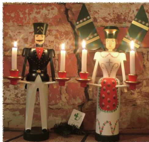
Nella regione dei Monti Metalliferi nel 17° secolo venivano usate figure di minatori al posto di candelabri classici di altare. Autocelebrazione anche simbolica: la luce in contrapposizione al buio della miniera.