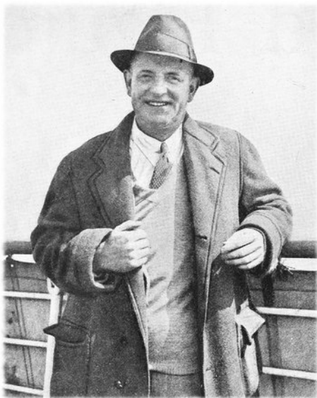
Wodehouse nel 1930 (a 48 anni).

[...] Preferiremmo non sentire piú niente di lui, sarebbe la cosa migliore per il bene comune. Il suo nome qua puzza, ma non andrebbe comunque in galera. Dovesse non esserci alcun posto, che egli venga qua, e nel caso non vi sia accusa contro di lui, che si ritiri vivendo da qualche parte o cuocia a fuoco lento nell'inferno, appena vi sia un posto libero.»