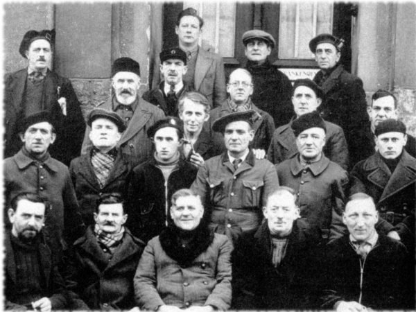
«Se questa è l'Alta Slesia come diavolo dovrà essere la Bassa Slesia?» P. G. Wodehouse (Terza fila, 3° da destra) 1941 nel Lager nazista di Tost.

Nelle intenzioni dichiarate di Wodehouse quei discorsi erano il modo piú diretto di rispondere alle tante lettere di lettori americani da lui ricevute durante la sua prigionia in Germania (42 settimane) e, grazie all'opportunità offertagli dalla radio tedesca, di far conoscere all'estero le proprie condizioni. In sintesi ripercorre i momenti dell'arrivo delle truppe tedesche a Le Touquet il 22 maggio del 1940, avvenuto, ci dice, in modo pacifico e ordinato, ma con la chiara intenzione di passare un «lungo weekend» nella sua casa requisita, poi l'arresto, il trasporto, la carcerazione, infine l'internamento in Germania.