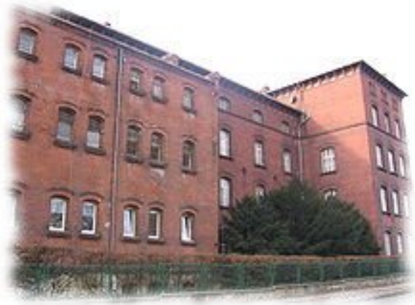
Tost, edificio dell'ex ospedale psichiatrico e Lager fino alla sua dissoluzione nel 1945.

clusi provano e tengono concerti, si organizzano serate di cabaret, si celebrano le messe domenicali e qui lui ha il tempo di scrivere un romanzo. Il tutto dà l'impressione di trovarsi non in un'improvvisata e provvisoria struttura, bensì in un autentico lager per civili la cui organizzazione risulta ben oliata e le funzioni gerarchiche chiaramente definite. Vi è sempre un interlocutore cui esporre reclami e una relativa libertà di movimento, l'opportunità di apprendere il tedesco, il francese, l'italiano, lo spagnolo, grazie ad una biblioteca ben fornita, e di seguire corsi di primo soccorso e stenografia. La sensazione è quella di essere studenti più che prigionieri. Nella ripartizione dei compiti anche l'età viene rispettata. Verso la fine del soggiorno i detenuti riescono perfino a stampare un proprio giornale chiamato The Tost Times . Wodehouse conclude la trasmissione ricordando affettuosamente i suoi compagni di prigionia che dice di aver amato, e chiude così la narrazione della sua avventura di internato britannico civile n° 796.