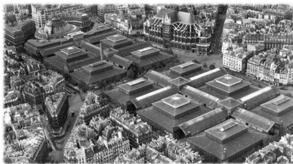
Les Halles (smantellate nel 1971).

Il grande storico Mumford, 17 parlando dei potenti sovrani dell'antichità, parla di una «paranoia edificatoria, che emana da un potere che vuole mostrarsi nello stesso tempo demone e dio, distruttore e costruttore».