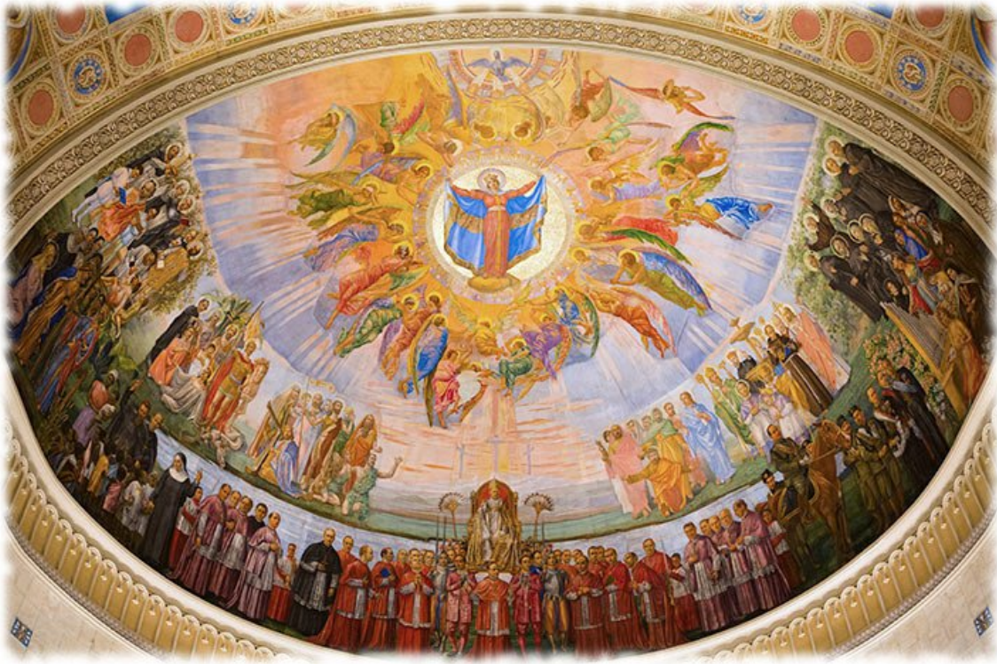
Fig. 9. Guido Nincheri, Salve Regina , decorazione a fresco dell'abside, 1930-33, chiesa della Madonna della Difesa, Montreal, Canada.

Il pittore toscano sottolinea da subito come il primo grande ostacolo per l'artista straniero sia rappresentato dallo scontro con le diverse mentalità delle nazionalità immigrate, in conseguenza del quale si trova costretto a «interpretare i gusti diversi di due razze distinte: la francese e l'irlandese e distruggere quindi quasi tutta la propria personalità». 70