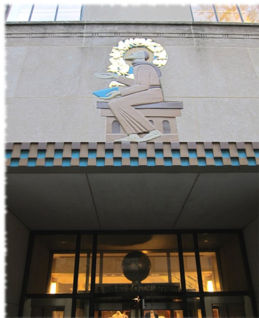
Fig. 2. Lee Lawrie, Saint Francis with Birds , bassorilievo in pietra, 1937, Palazzo d'Italia, Rockfeller Center, New York City.