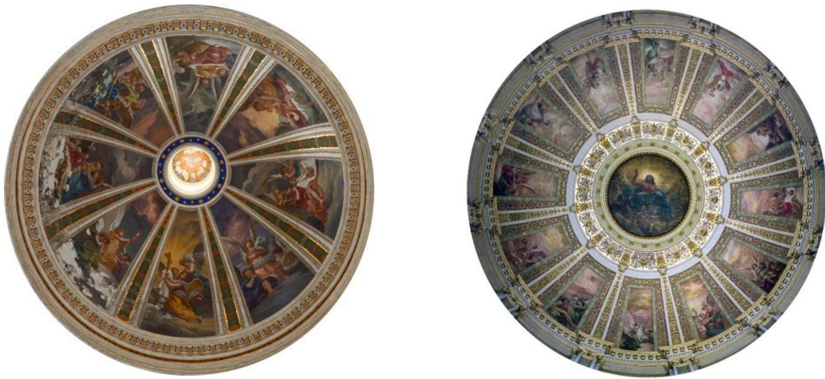
Fig. 11. Confronto tra la cupola della cappella del Crocifisso nella chiesa di Sant'Ignazio in Roma (a sinistra) e quella della cattedrale di Filadelfia (a destra), il cui clipeo centrale è opera precedente di Costantino Brumidi, artista romano esule famoso per aver affrescato il Campidoglio di Washington.

nelle illustrazioni di famosi libri di catechismo dell'epoca (v. fig. 12). 81