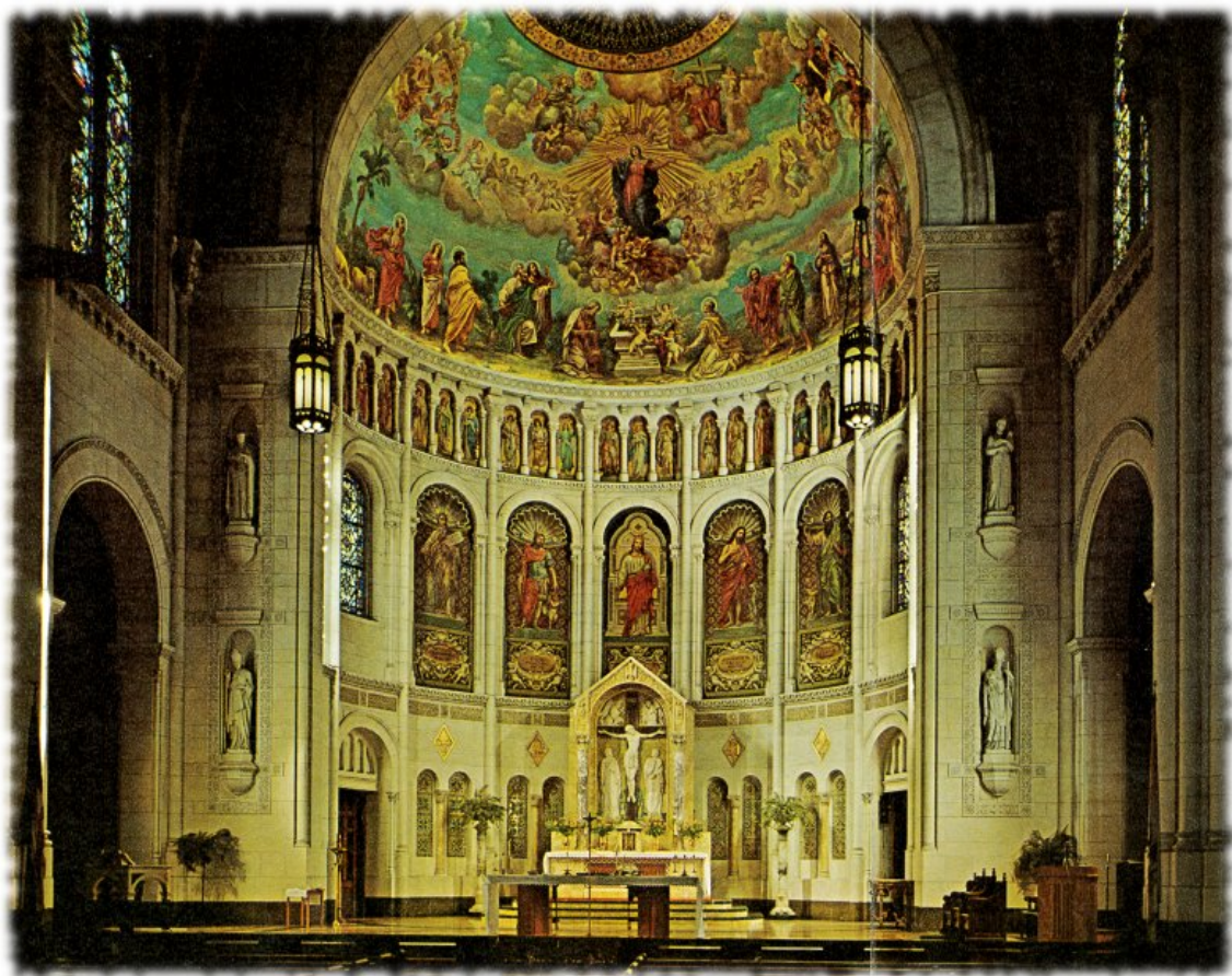
Fig. 13. Interno del santuario di Our Lady of Perpetual Help in Brooklyn, New York City, decorazione a cura dello studio di Ilario Panzironi, 1893 circa.

Senza entrare nei dettagli del furto e della miracolosa restituzione delle corone di diamanti benedette dal papa Pio XII — di cui si è parlato in precedenza — che erano state collocate sul capo della Beata Vergine e del Bambin Gesù dal vescovo di Brooklyn, l'opera ha in sé qualcosa di unico e degno di encomio.