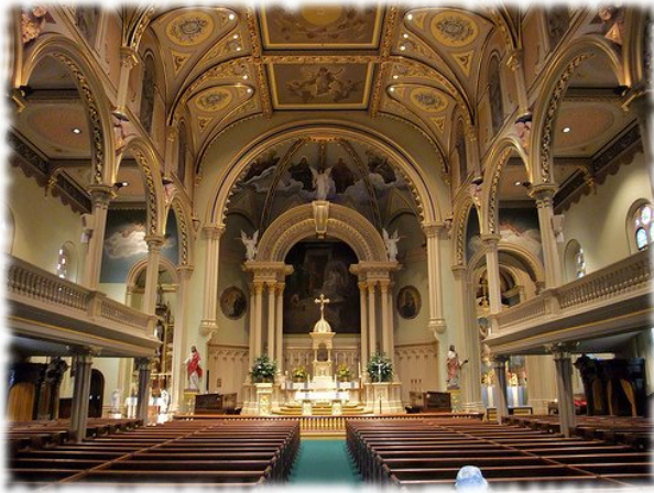
Fig. 7. Interno della chiesa di St. Mary di Albany, N.Y., la cui decorazione è frutto del lavoro congiunto di Pagani e Panzironi.

L' Italian Home , fondata nel 1889, era infatti una sorta di versione cattolica delle settlement houses protestanti: forniva aiuto e protezione agli italiani immigrati (e in casi di emergenza a individui di ogni nazionalità e credo), assistenza ai malati, istruzione per l'apprendimento della lingua inglese, pasti gratuiti. 57