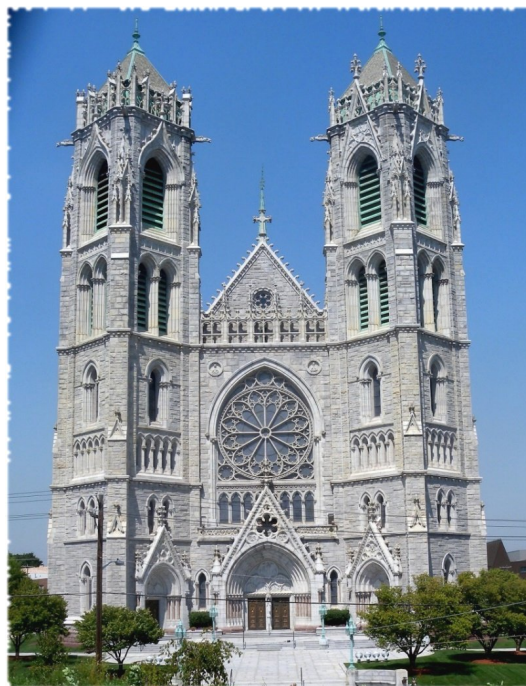
Fig. 3. Visione esterna della cattedrale Sacred Heart di Newark, New Jersey.