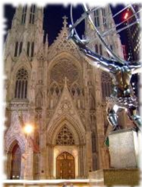
Fig. 1. La statua di Atlante del Rockfeller Center fronteggia, quasi a tono di sfida, la facciata della cattedrale di St. Patrick.

Scolpita nel 1937 da un artista americano nato in Germania, Lee Lawrie, e inserita a decorazione del palazzo che nel progetto affaristico del multimiliardario doveva ergersi a simboleggiare l'Italia tra gli altri edifici rappresentativi della vecchia Europa, essa resistette allo smantellamento che invece interessò tutte le altre formelle del Bel Paese non appena gli Stati Uniti furono coinvolti nella Seconda guerra mon-