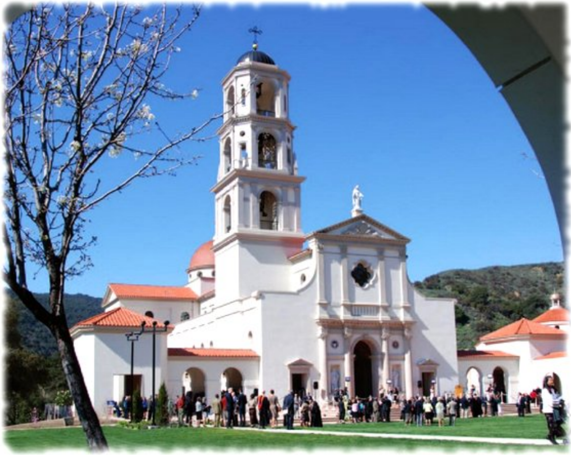
Fig. 15. Visione esterna della cappella Our Lady of the Most Holy Trinity Chapel in Santa Paula, California, progettata nel 2009 da Duncan Stroik e Rasmussen Associates.

corretto equilibrio tra estremo realismo e l'eccessivo simbolismo con una delicata attenzione ai bisogni della comunità cristiana piuttosto che al particolare gusto o talento del singolo artista.