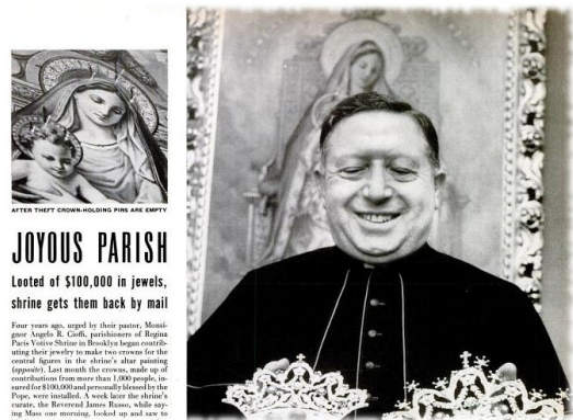
Fig. 5. Mons. Angelo Gioffi mostra le due corone restituite (foto tratta da un articolo comparso sul settimanale Life il 23 giugno 1952).

47 «New Mural for Bank on 80th Anniversary», in The New York Age , 13 maggio 1939. Non è stato purtroppo possibile ricostruire le tappe e i traguardi della formazione accademica di Ilario Panzironi, in quanto l'archivio storico dell'Accademia di Belle Arti di Roma è al momento in fase di riordino e quindi chiuso agli studiosi. Il card. Ricci menzionato nell'articolo corrisponde al rev. Francesco Ricci Paracciani (1830–1894), eletto cardinale nel 1882 e nominato nel 1891 prefetto della Sacra Congregazione della Fabbrica di San Pietro. L'archivio familiare dei Paracciani, sotto la sorveglianza della Soprintendenza della Toscana, è aperto alla consultazione solo una volta l'anno. Da un primo sopralluogo si è verificato che il cardinale fu socio della Primaria Associazione Cattolica Artistica ed Operaia di Carità reciproca in Roma, di cui ricevette l'attestato commemorativo (1891 circa) in occasione del ventesimo anniversario della sua fondazione. Cfr. ARCHIVIO FAMIGLIA RICCI PARACCIANI, fasc. TV/9. Probabilmente fu in queste vesti che egli esercitò un importante ruolo di mecenate. Nessun esito invece è emerso dall'archivio della Fabbrica di San Pietro: Ricci d'altronde ne fu nominato prefetto nel 1891, quando il Panzironi aveva già preso la via dell'America.