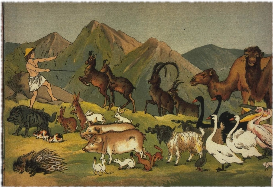
Canguri, e poi cammelli, stambecchi agili e belli,