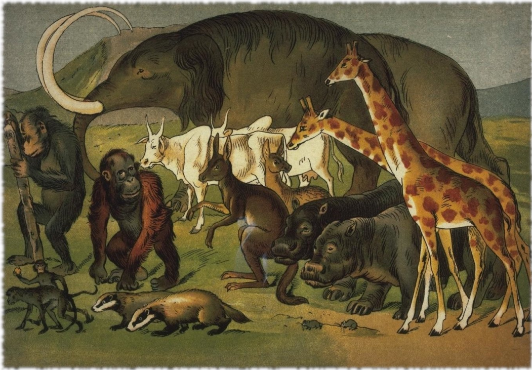
Scimmiettotti alti e bassi, ippopotami, tassi,