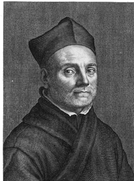
P. ATHANASIVS KIRCHERVS. FVLVDENSIS è Societ: Iesu Anno ætatis LIII. Hænoris et observantis ego sculpsit et D.D. C. Bloemert Roma 2 Maji A. 1665.

L'autorità di Kircher accredita così la leggenda, che circolava in tutta Europa, non solo nell'area mediterranea. Con la sua trattazione, presentata come una cronaca, la vicenda di Colapesce si radica nella costa siciliana, a sua volta evocativa di eventi mitici e del poema omerico. Una scienza che guardava alla natura come creazione divina, ma anche come meraviglia e miste-