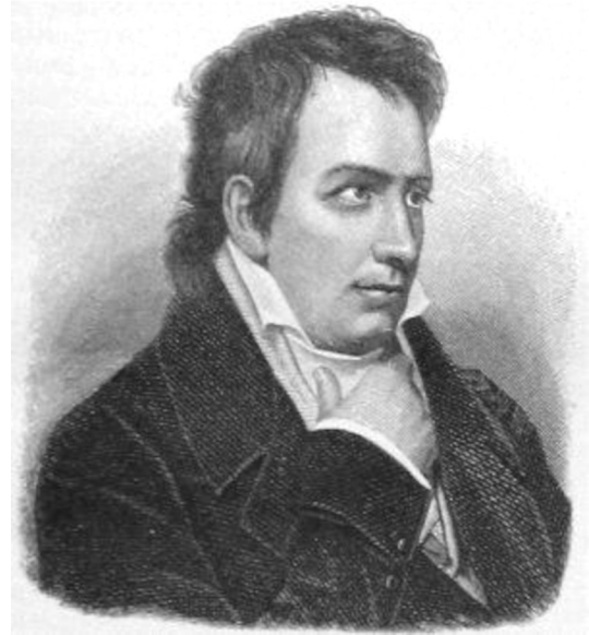
Ludwig Tieck (1773-1853).

non rechi effigi dei più squisiti eroi della libertà e non sia illuminato dai ritratti di Mirabeau, Washington, Franklin, Kosciusko, ma anche dai disconosciuti Robespierre e Danton. [...]