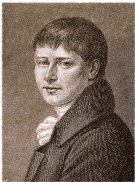
Heinrich Wilhelm von Kleist (1777-1811).