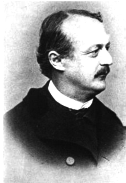
Conrad Ferdinand Meyer (1825-98).

Quasi assopito giaccio ore ed ore al sole che mi scalda e che m'abbaglia, poi lotto con le onde, la battaglia in allegria, di forza e di valore.