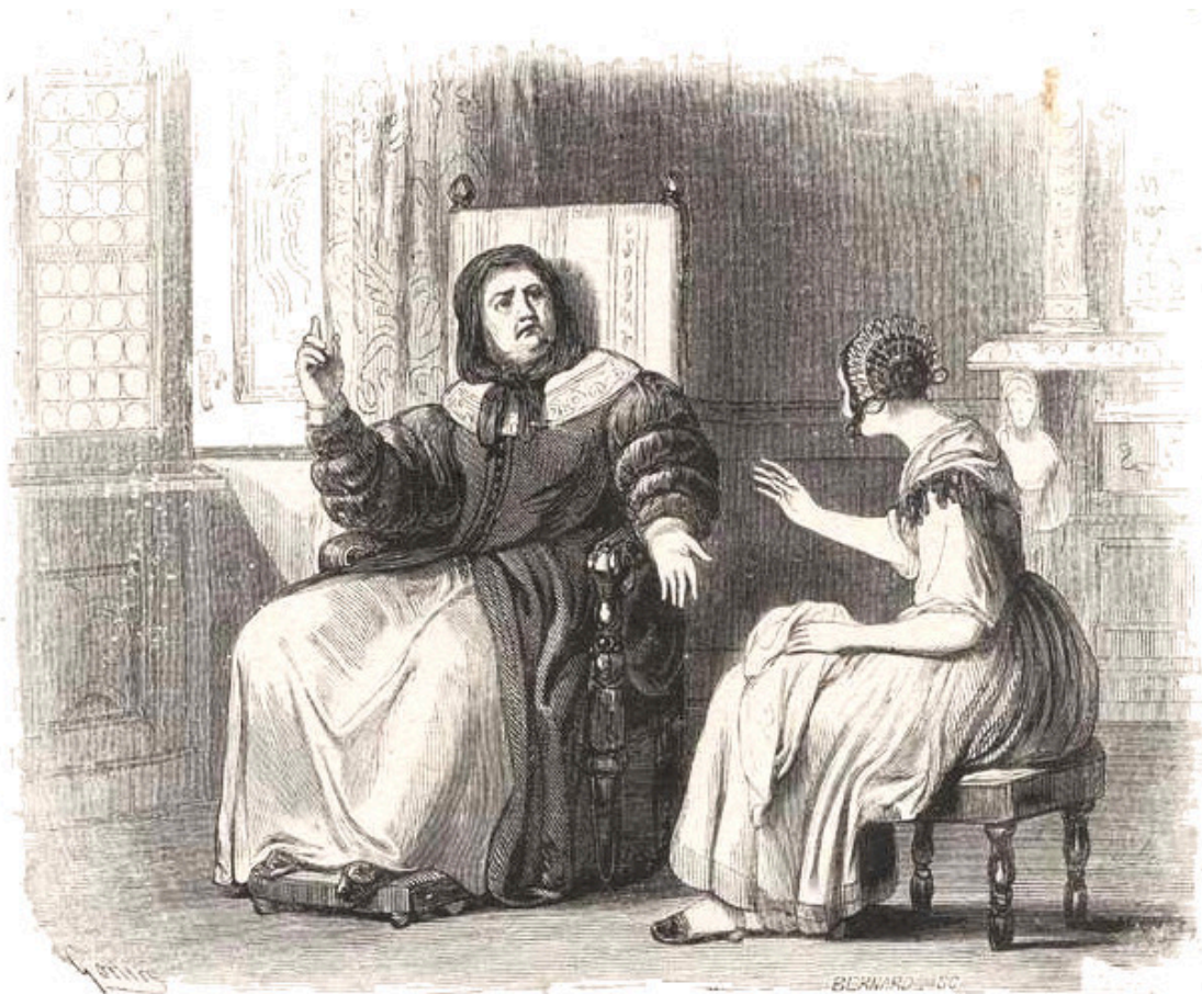
Donna Prassede e Lucia. Illustrazione di Francesco Gonin, incisione di Bernard, dall'edizione del 1840.