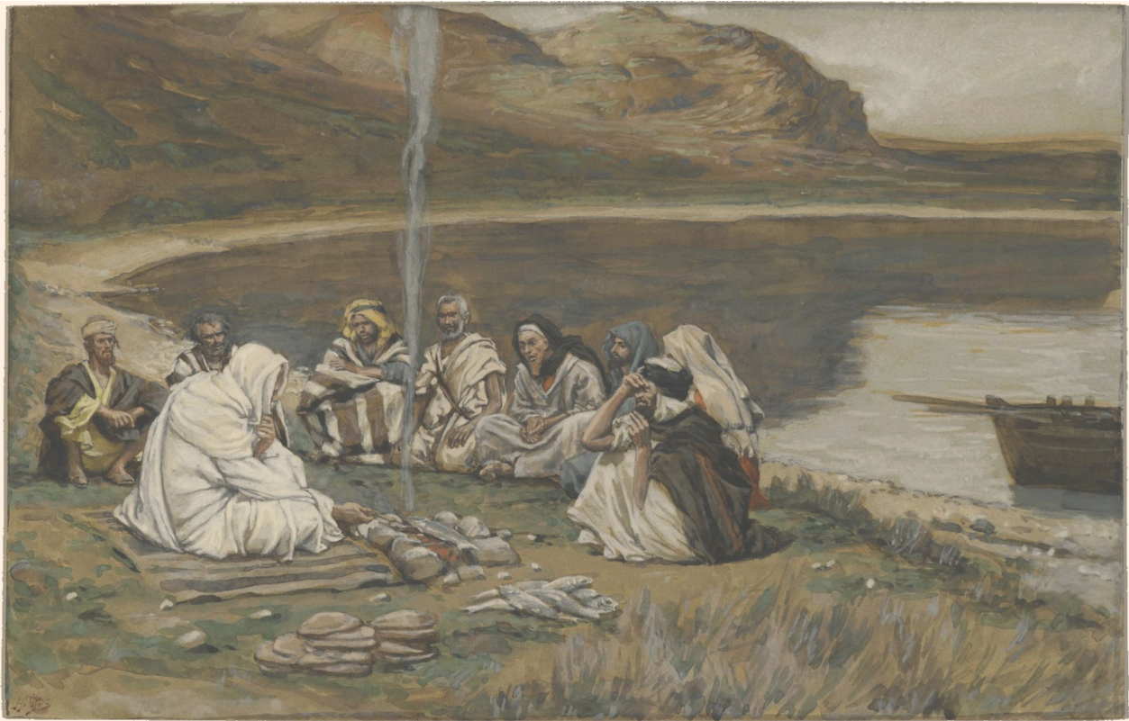
James Tissot, Repas de Notre-Seigneur et des apôtres , 1886–1894, acquerello.

notte sulla riva del lago, trova i discepoli, confusi, tornati a fare i pescatori, a mani vuote. Non li rimprovera, non li sprona a una nuova impresa attivistica, non li invita a ristrutturare la loro esistenza. Dice semplicemente: «Gettate la rete» e al mattino, quando la pesca miracolosa si conclude, «Portate un po' del pesce che avete preso or ora», aveva già preparato la brace per arrostarlo. «Venite a mangiare». Finisce quasi come un albo di Asterix con tutto il villaggio a tavola, che brinda e canta. Nel brano si manifesta qualcosa che l'agostinismo ha allontanato dal cristianesimo occidentale: la gioia del Semplice carnale e conviviale. Qui non c'è l'affanno delle emergenze di Marta, non c'è il tormento di una donna Prassede che confonde il suo cervello con il cielo, non c'è il povero come facchino provvidenziale per la salvezza del ricco. C'è invece il godimento ridondante della certezza della Presenza, la gioia del Semplice — lasciar-essere, φίλια, ωυ-wei — carnale e conviviale.