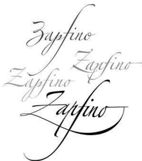
Esempio d'uso di Zapfino : si notino le varianti di forma della stessa lettera

maggior parte delle lettere e una massiccia serie di swash e legature. Tuttavia il processo di digitalizzazione e di implementazione della font si rivelò proibitivo in termini di tempo e tutto fu sospeso fino al 1997 quando Zapf portò i suoi disegni e le prime digitalizzazioni di Siegel alla Linotype.