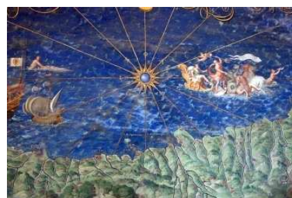
Musei Vaticani Carta d'Italia Particolare

Togliete alla cultura gli stili gotico e romanico, eliminate gli archi, le costruzioni a volta, la chiave d'arco, sottraete la pianificazione urbanistica, i giardini, le fontane, tutte le città europee, castelli, fortezze, guglie, ponti gobbi, colonnati e atrii, cancellate pure tutta San Pietroburgo e scrollate dalle mani le sue ceneri, come se non fosse mai esistita. Via, al diavolo tutto. Il Rinascimento, fuori. Giotto, Michelangelo, Raffaello... via, via! Dimenticate tutta la pittura: è stata solo un sogno. L'opera lirica? Scomparsa, come peraltro il canto in generale, e foratevi pure i timpani. Spargete il vino, perché berrete ciofecca d'orzo.