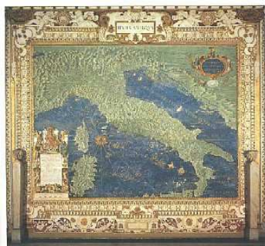
Musei Vaticani Carta d'Italia

mai? Dove sono i consoli, i proconsoli, il senato, i partiti, i patrizi, i plebei, e insomma la repubblica? E il diritto romano? Ehi! E dove sono i teatri? Dove gli storici, gli oratori? Forse si entusiasmerà un persiano all'udire il chiasso e il fremito del pubblico che prende posto a teatro – e nel mentre il cielo si fa più scuro, l'oleandro approfondisce il suo aroma, e sta per spegnersi Venere, la stella della sera, che non è affatto una stella...? Forse un persiano andrà in estasi davanti ai rotoli degli storici, ai processi e agli agoni giudiziari? Rimarrà incantato dall'arringa di un Cicerone oppure – vista la mancanza – di un Demostene? Potrà mai provare rispetto per un'istituzione simile, e d'incanto desiderarla anche a casa propria, per avere uno spazio pubblico dove qualunque volenteroso verrebbe a battere la lingua? Impalare, piuttosto, e bonificare i fori con la calce viva! Addio Padva e Kučerenci... 1 E dove sono le terme, i vestiti leggeri, dove i menti rasati, le ville con terrazze? Dove sono le matrone di rispetto, le degne madri dei degni cittadini? Dov'è il rispetto dei patti? Dov'è il bene pubblico? La poesia, la poesia dov'è mai? E la satira!!! Chi tra i persiani sopporterebbe poi la satira? E la corrispondenza privata? Le gare sportive a nudo? La libertà di fronte agli dei?