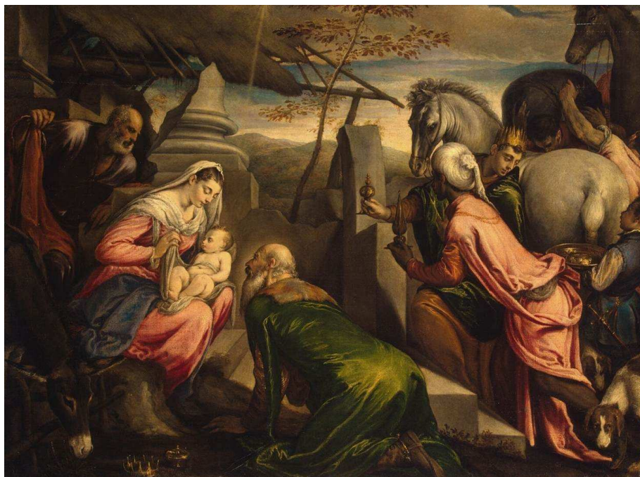
Francesco Bassano, Adorazione dei Magi , 1567-69, Ermitage, San Pietroburgo

Abbiamo dovuto cercare all'Ermitage il dipinto con la Natività perché quest'anno il racconto che tradizionalmente accompagna il numero natalizio viene dalla Russia, ed è molto speciale: si tratta della prima traduzione in italiano di un testo della grande scrittrice russa Tatjana Tolstaja , che ringraziamo di tutto cuore, insieme alla traduttrice Maria Zolotkova, per la disponibilità. Come vedrete, Senza , così s'intitola il testo, è uno straordinario omaggio alla nostra Italia (a proposito, a chi scrive, quanto risulta orribile il termine "questo paese"...), ma non c'è bisogno di aggiungere altro perché la postfazione di Stefano Serafini spiega tutto. Conclude, ripresa dall'edizione 2003,