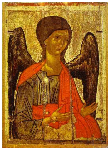
Icona russa, Arcangelo Michele , 14° sec.

Nelle sale delle Icone della Galleria Tret'jakovskaja di Mosca incrocio una giovane monaca ortodossa. Ha il vestito lungo e nero, il fazzoletto in testa sui capelli raccolti, e l'atteggiamento umile delle monache. Ma soprattutto, davanti ad ogni icona della Galleria, si fa ripetuti segni della croce, si inchina e mormora una serie di preghiere come se fosse in una chiesa ortodossa.