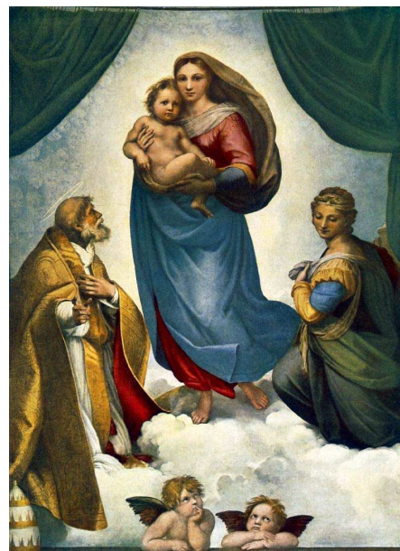
Raffaello Sanzio Madonna Sistina 1512-1514

«la Sistina “non sarebbe legata ad una chiesa, né esigerebbe una determinata collocazione” [...] è corretto se pensato esteticamente, eppure manca della verità più propria. In qualunque posto dove questa immagine potrà ancora essere collocata, là essa avrà già perduto il suo luogo. Le resta preclusa l'ostensione della sua essenza in maniera inaugurale, vale a dire la determinazione di questo stesso luogo. L'immagine, trasformata nella propria essenza in quanto opera d'arte, si smarrisce nell'estraneo. [...] La rappresentazione museale livella ogni cosa nella uniformità dell'esposizione ( Ausstellung ). In questa non c'è alcun luogo ma solo posti. La Sistina dovrebbe stare in una particolare chiesa di Piacenza non in senso storico-antiquario ma secondo la sua essenza di immagine. In conformità a questa, l'immagine esigerà sempre di essere in quel luogo».