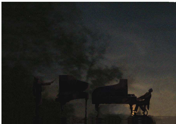
Alzek Misheff Clair de lune Project for a real size sculpture 2010

gno necessario, in qualche modo atteso, una sollecitazione a cui viene di rispondere, proseguire il discorso, passare il testimone. Langone parla in un'ottica di condivisione, ma nel modo più personale, umorale, da anarca. Siamo d'accordo, ognuno a suo modo: è l'esatto contrario delle ideologie, che compattano i minuti conformismi e le infime viltà.