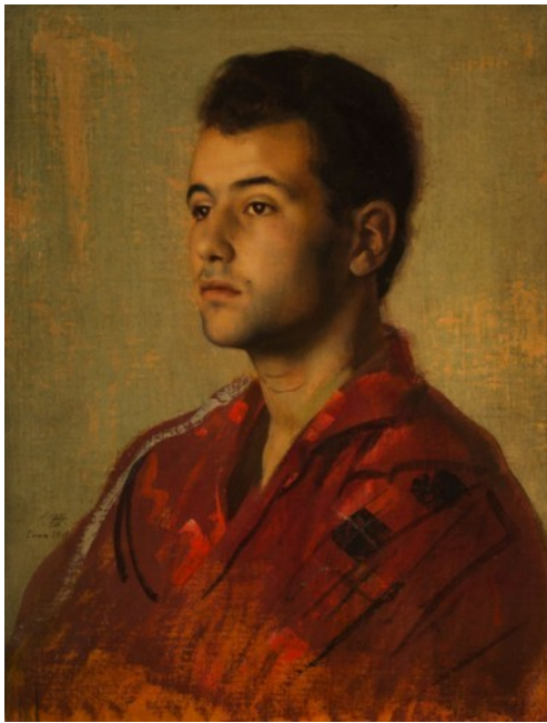
Pietro Annigoni Ritratto del figlio

Si tratta in ogni caso di sistemi filosofici e religiosi complessi e raffinatissimi. A me sembra quanto meno azzardato considerarli proiezioni mentali o immagini poetiche, o peggio ancora costruzioni intellettuali elaborate a posteriori per giustificare e dare dignità intellettuale a pratiche di oppressione fondate solo sui rapporti di forza e sull'interesse materiale. Fosse così, non sarebbe proprio questa stupefacente e millenaria capacità di dissimulazione un indice di "superiorità" anche intellettuale, oltre che fisica, del maschile? (A. E.)