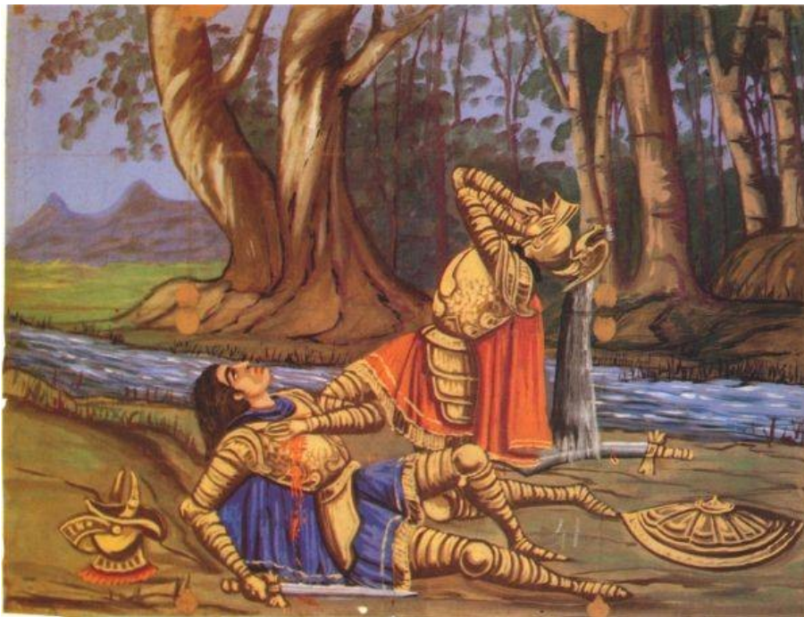
Cartellone di teatro dei Pupi Morte di Clorinda uccisa da Tancredi

Non morì già, ché sue virtù accolse tutte in quel punto e in guardia al cor le mise, e premendo il suo affanno a dar si volse vita con l'acqua a chi col ferro uccise. Mentre egli il suon de' sacri detti sciolse, colei di gioia trasmutossi, e rise: e in atto di morir lieta e vivace dir pareva: "S'apre il ciel: io vado in pace".