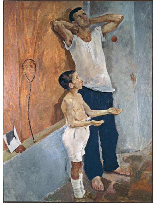
Fausto Pirandello Padre e figlio .

le) costretto, senza differenze, a produrre e a consumare merci neutre, istituzionalmente scarse, egualmente desiderabili o necessarie per esseri neutri in competizione appartenenti a due sessi biologici.