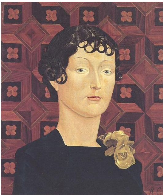
Edith Waltherowna Broglio Testa su fondo di tarsia (1938)

mattino, uccideva, stuprava e saccheggiava e tornava poi tranquillamente a casa, dove subiva i rimproveri muliebri quando il bottino non era abbastanza ricco. Significativamente, a capo delle bande di massacratori vi era una donna, Pauline Nyiramasunhuko, allora ministro della “Famiglia e della promozione femminile”, accusata di genocidio e di stupro come crimine contro l’umanità. Pauline guidava gli squadroni della morte, autonominati “Interahamwe”, il branco, che, oltre all’assassinio indiscriminato di uomini, donne e bambini, praticavano con sistematicità lo stupro di massa, di cui, secondo dati ONU, furono vittime 250.000 donne. Il suo ruolo era quello di sovrintendere alle azioni degli squadristi, fra cui suo figlio, e di incitarli esplicitamente allo stupro, col pretesto che le donne tutsi erano “orgogliose e seduttrici”.