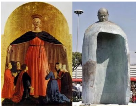
DA PIERO A RAINALDI: DECADENZA DELL'ARTE

La rappresentazione dello stesso gesto di accoglienza, protezione e misericordia dal passato al presente, dalla limpida composizione architettonica delle figure all'informe cavità, dal pieno al vuoto, dalla sapienza artistica del simbolo alla banale espressione individuale del niente, dalla eleganza alla volgarità, dal sacro al profano.