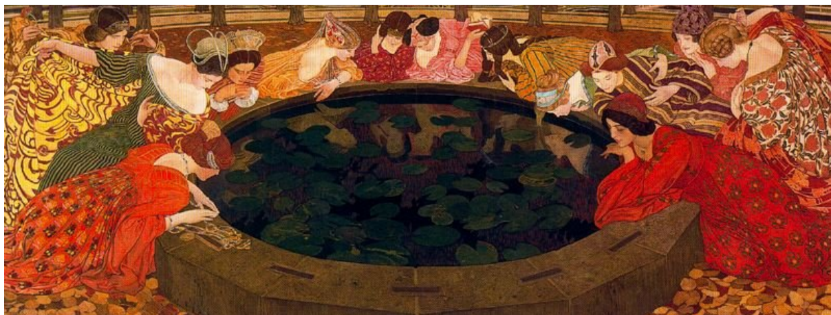
Ernest Biéler L'acqua misteriosa (1911) Museo Cantonale delle Belle Arti di Losanna.

triste della propria libertà assoluta, slegata dalla verità del bene e da ogni relazione sociale”.