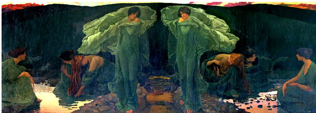
Ernest Biéler Le sorgenti (1900) Kunstmuseum Bern

Noti teologi e elites cattoliche vissero un gratificante senso di ‘mutazione’, che li ha fatti vagare in attesa del niente, prima nel mimetismo delle ideologie ‘rivoluzionarie’, poi delle loro trasformazioni New Age. Il Concilio ha responsabilità riguardo alla sua stessa ricezione, contemporanea e posteriore, gravemente alterata?