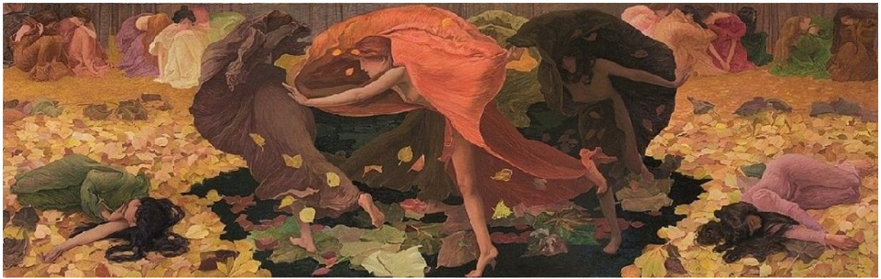
Ernest Biéler Le foglie morte (1899) Kunstmuseum Bern

Ad evocare il «fuoco di torbiera» che forse circola sotto gli squallidi orpelli dell'AC, riportiamo un brano dal catalogo della mostra, che fino a qualche tempo fa non ci si poteva aspettare (del resto nemmeno una mostra di Biéler, che il Museo di Losanna teneva nei depositi). Motivando la trascuratezza subita dalle sue opere simboliste della fine dell'800 e l'interesse solo regionale attribuito a quelle del 900 inoltrato, M. Frehner scrive: