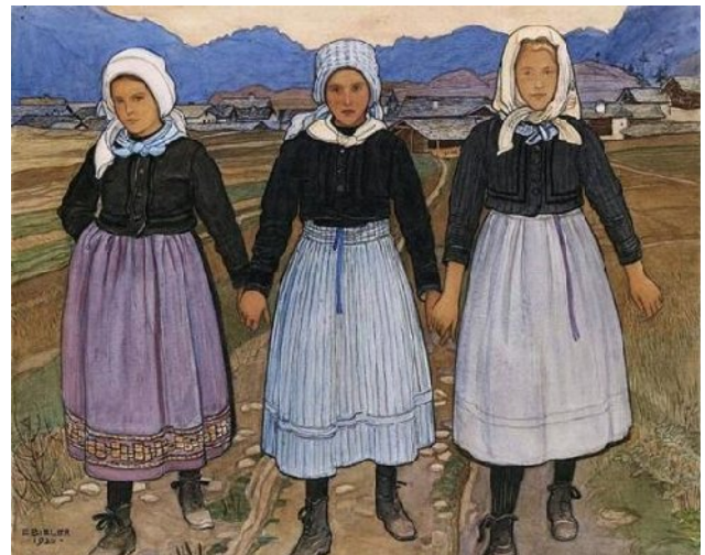
Ernest Biéler, Tre fanciulle di Savièse (1920).