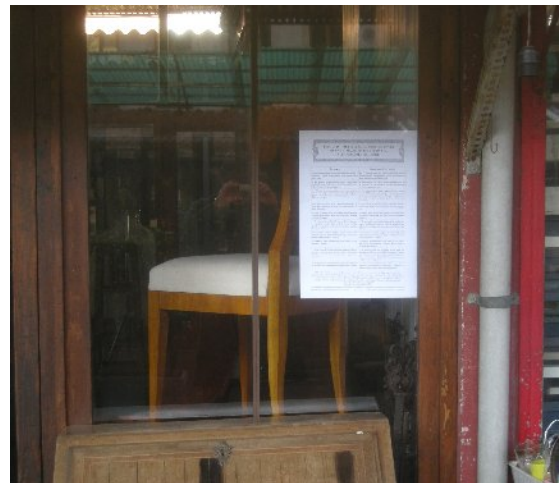
Firenze, piazza De' Ciompi. Altro stand.

«V'era in lui qualche cosa di ciò che anticamente chiamavano solennità conviviale; quando dicevano: celebrare , anche per una semplice mascherata o un banchetto di nozze. Ma non era un pagano, più di quel che fosse un puro e semplice burlone. Le sue eccentricità nascevano da una fede ben fondata: mistica, infantile e cristiana.