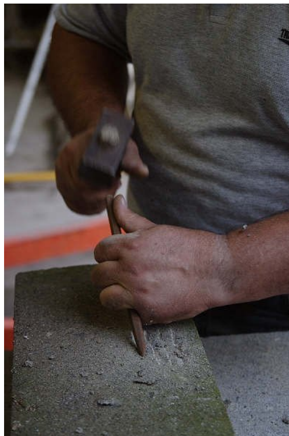
Le mani dello scultore.

Siamo costretti ad essere assai duri con la gente. Perché hanno voluto distruggere i legami con la natura, con l'anima umana, con l'esistenza di un ordine superiore? Gli uomini d'oggi hanno reciso i legami con il nutrimento generato dall'atto creativo, perché non creano più, confondono ormai la vera e propria spazzatura con l'arte, sono stati convinti che un museo pieno d'oggetti schifosi rappresenta la creazione artistica. Stimano oggetti e edifici che rappresentano tutto ciò che tradizionalmente era proibito, che rappresentano l'escremento,