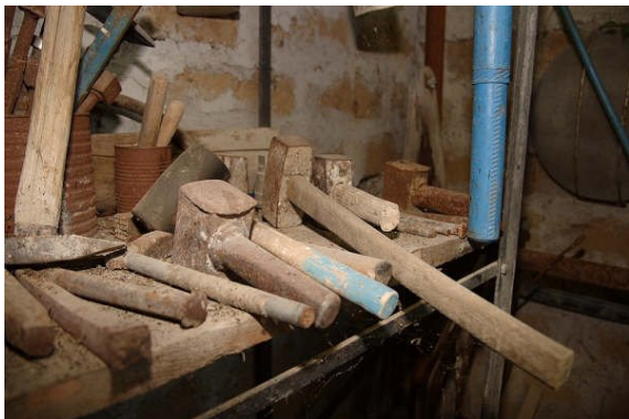
Gli attrezzi dello scultore.

con rapidità preoccupante, è, infatti, l'anima umana ad essere danneggiata se non creiamo niente personalmente. Tutto oggi si deve comprare, tutto è un prodotto industriale, la possibilità di creare non esiste, è stata dimenticata nei decenni passati. I «contemporanei» hanno soltanto parole di condanna, e paura, per il passato, convinti che qualsiasi sguardo all'indietro sia un tradimento dello sviluppo civilizzatore.