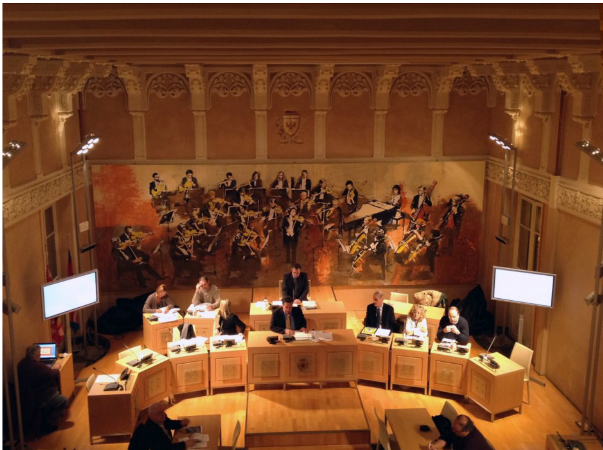
Acqui Terme. La sala del Consiglio Comunale col grande dipinto di Alzek Misheff. Nelle immagini precedenti dettagli del dipinto e la targa bronzea dei mecenati.