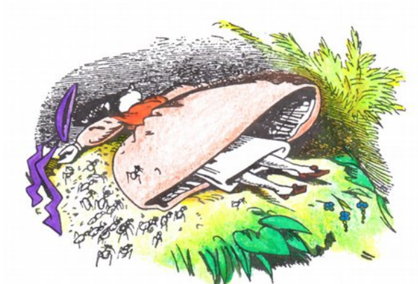
Adele — ohimè! — si sente venir meno per il ribrezzo, e giace sul terreno.