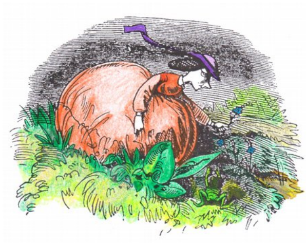
Per raccogliere un fiorellino blu (nontiscordardimè!) si china giù.