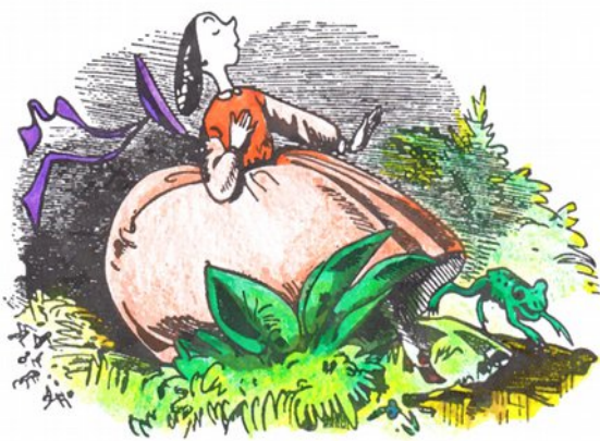
Salta nell'acqua, su dall'erba fresca, una fradicia rana gigantesca.