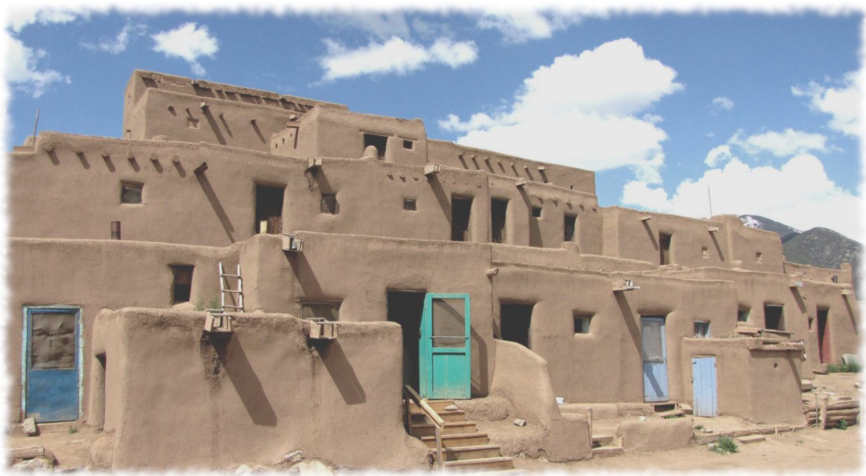
Architettura senza architetti. Taos Pueblo, New Mexico.

L'argomento divisione del lavoro , segue la sorte di vari altri, anche affini come tecnica e protesi o meno come proprietà privata . La sorte è quella di essere dibattuti sulla loro natura (buona o cattiva di per sé) e non sulla loro misura , ma questo è un altro discorso. ❀