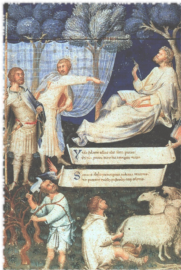
«Virgilio ambrosiano», miniato da Simone Martini. Il manoscritto era posseduto da Francesco Petrarca, con migliaia di postille autografe (Biblioteca Ambrosiana di Milano).