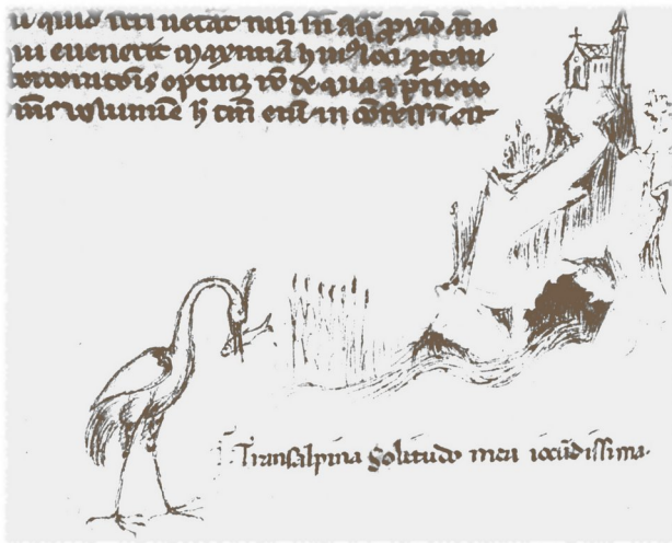
Disegno di Valchiusa con postilla autografa di Petrarca, rappresentato dal pellicano: transalpina solitudo mea iocundissima (Biblioteca nazionale francese).

La sera è costretto ad uscire una seconda volta da casa.