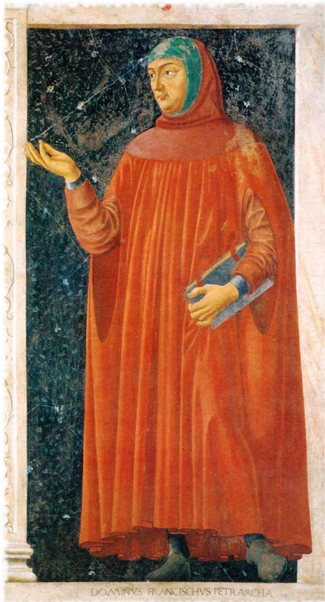
Francesco Petrarca. Affresco di Andrea del Castagno (1450). Galleria degli Uffizi (Firenze).

Il tema non ha soltanto interesse letterario, considerato il ruolo del mondo rurale nella storia. Si vedano Giulio Bollati («L'Italiano», in Storia d'Italia , 1972) e Fabrizio Rondolino ( L'Italia non esiste , II ed., 2025), i quali criticano una supposta prevalenza dell'ideologia rurale in Italia a partire da Vincenzo Cuoco ( Platone in Italia , 1806) e sul fronte opposto la persistente nostalgia della campagna e le esperienze di nuove forme di ritorno alla terra, che giungono fino ai nostri giorni (v. Il Covile N° 734/XVII, 15 novembre 2025: «Meglio in provincia»).